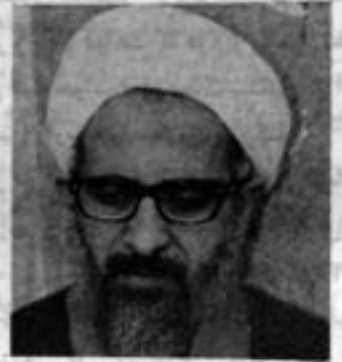
آیت‌الله جوادی آملی