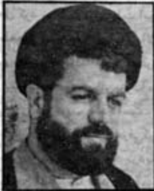
حجة الاسلام والمسلمین موسوی تبریزی