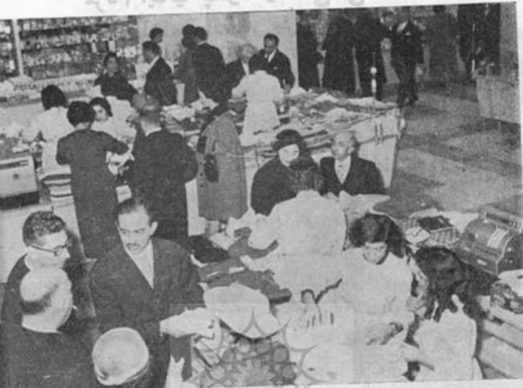
در سان بزرگ فروشگاه فردوسی. این عکس پس از افتتاح از مراجعین در موقع خرید اجناس برداشته شده است.

۱۳۸۰۰۰۰ نفر تخمین زده میشود، در ایام بهار و تابستان جمعیت پنجاه تا صد هزار نفر اضافه می شود. زیرا هیچیک از سیاحان خارجی بدون مشاهده رم بنقاط دیگر ایتالیا مسافرت نمی کنند. شهر معروف سینما می ایتالیا بنام «چینه چیتا» و شهر مذهبی و اتیکان که مقر حکومت پاپ اعظم است در حومه رم قرار دارند. و اتیکان که در نقطه مرتفعی قرار گرفته دارای حکومت مستقل و خود مختاری است که تحت ریاست پاپ اعظم اداره میشود. این شهر مراکز برق و فرستنده لوله کشی و ایستگاه راه آهن و قطار مخصوص بخود دارد و بوسیله انجمنی که اعضای آن از طرف پاپ تعیین میشود اداره میگردد. و اتیکان دارای موزه ها و کلیساها و معابد بزرگ و تاریخی است که تماشای سطحی آنها لااقل یکروز از وقت مسافرتین خارجی را اشغال می کند. زیباترین و مجلل ترین نقاط و اتیکان مقر پاپ اعظم است که بر میدان بزرگ و