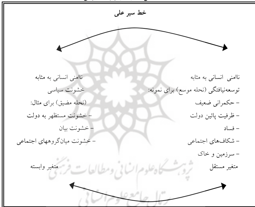
شکل ۱: چارچوب مفهومی

نقطه تأکید و تمرکز این چارچوب عبارت است از: ۱) ناامنی انسانی به مثابه خشونت سیاسی، ۲) علل و عوامل ناامنی انسانی به مثابه خشونت سیاسی. بر اساس زبان و ادبیات علوم انسانی، ناامنی انسانی به مثابه خشونت سیاسی (دیدگاه مضیق) متغیر وابسته است. بسیاری از علل و عوامل ناامنی انسانی به مثابه خشونت سیاسی، دربرگیرنده مسائل و مشکلات توسعه است که به عنوان متغیرهای مستقل هستند (بنگرید به شکل ۱).