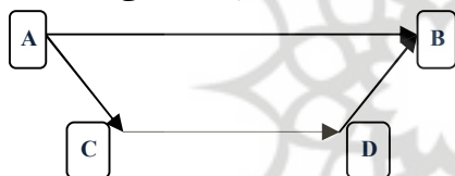
شکل شماره (۱): الگوی تلفیقی سطح خرد، کلان و مسیر تاریخی

این سیستم مینیمال امکان پیوند بین اجزای کلان یا ساختار با انگیزه و کنش فاعل را از کانال اطلاعات دریافتی او فراهم می‌آورد. به این ترتیب می‌توان آن را یک تیپ ایده‌آل وبری تعمیم‌یافته معرفی کرد که محرک‌های ساختار نهادی در آن دیده شده و کنشگر نیز به عنوان بازیگر تحلیل می‌شود.