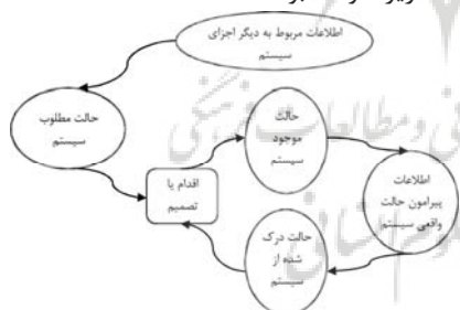
شکل شماره (2) - ساختار کلی حلقه بازخور منفی

رشد نمایی یا کاهش در سیستم‌های پویا را از طریق مکانیسم‌های خودفشار مجدد ۱۵ به وجود می‌آورند. سیستم در نتیجه فعالیت حلقه بازخور منفی به تدریج به سمت مقداری معین میل می‌کند تا خلأ بین شرایط موجود و شرایط مطلوب را پوشش دهد. به دیگر سخن فرایندهای مربوط به حلقه بازخور منفی از یک مکانیسم خودتصحیحی ۱۶ برخوردارند که سیستم را به سمت ثبات سوق می‌دهد. البته ممکن است حلقه بازخور منفی به علت تأخیر در شروع فعالیت به ناپایداری نیز بینجامد. مکانیسم خودتصحیحی در ادبیات آشوب به مفهوم کارایی انطباقی نزدیک‌تر است. تنها تفاوت این است که در اینجا فشار وارده به سیستم، نقطه آغاز تحلیل نیست، بلکه فاصله بین شرایط موجود و مطلوب یا آرمانی که به شرایط اولیه حساسیت دارد و یک پویا درونی سیستم است، نقطه شروع تحلیل به شمار می‌رود. به واسطه این تعریف از مکانیسم خودتصحیحی، مشکل پویایی‌نگاری خطی سیستم نیز مرتفع می‌شود. گرچه پذیرش تعریف بالا به معنای نفی احتمال ورود شوک به سیستم نیست، اما مفهومی عمومی‌تر از کارایی انطباقی به دست می‌دهد.