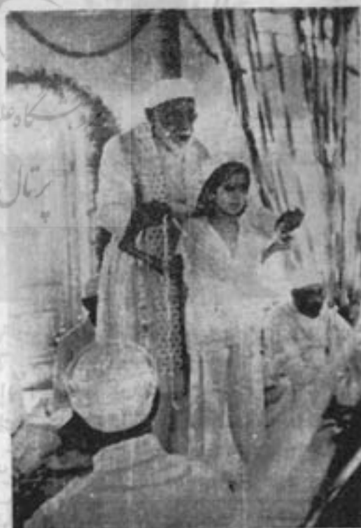
دو گره در پشت کمر کودک بکشتی میزند

کوبد که وارد جرگه زرتشتی گری شده است . بعد والدین و خویشان کودک باو تبریک می گویند و هر یک هدایای خود را تقدیم می دارند و مراسم با خوردن شربت و شیرینی و احياناً نهار کامل ، و پایان می پذیرد .