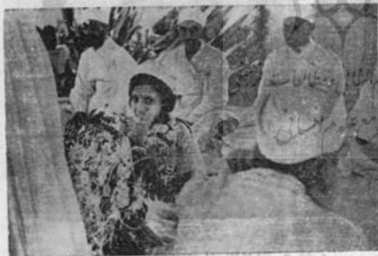
هریک هدایای خود را بکودک تقدیم میدارند

پس از اینکه طفل کلام شهادت را بکمک دستور و در حضور جمیع موبدان ادا کرد مراسم مدره پوشی پایان میرسد و کودک لباس میپوشد و دستور « دعای تندرستی » را که بزبان پهلوی است باهنگ دلپذیر و مخصوص میسراید و در ضمن مثنی « لرك » و برنج ( در هندوستان ) و آویشن برشانه و سر کودک میباشد و در پایان باوتیریک می-