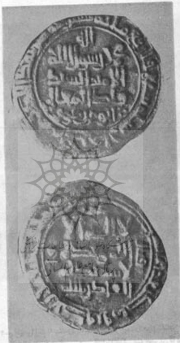
سکه (درهم) سیمین فک المعالی