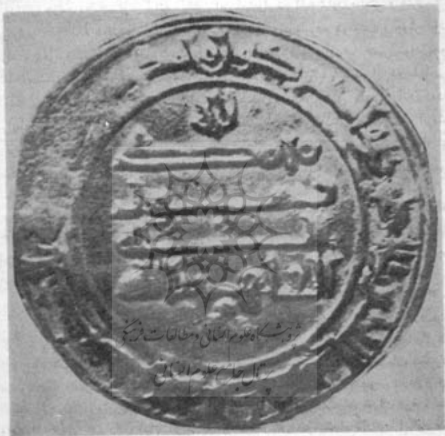
پشت سکه مرد آویج با نام خلیفه القاهر بالله