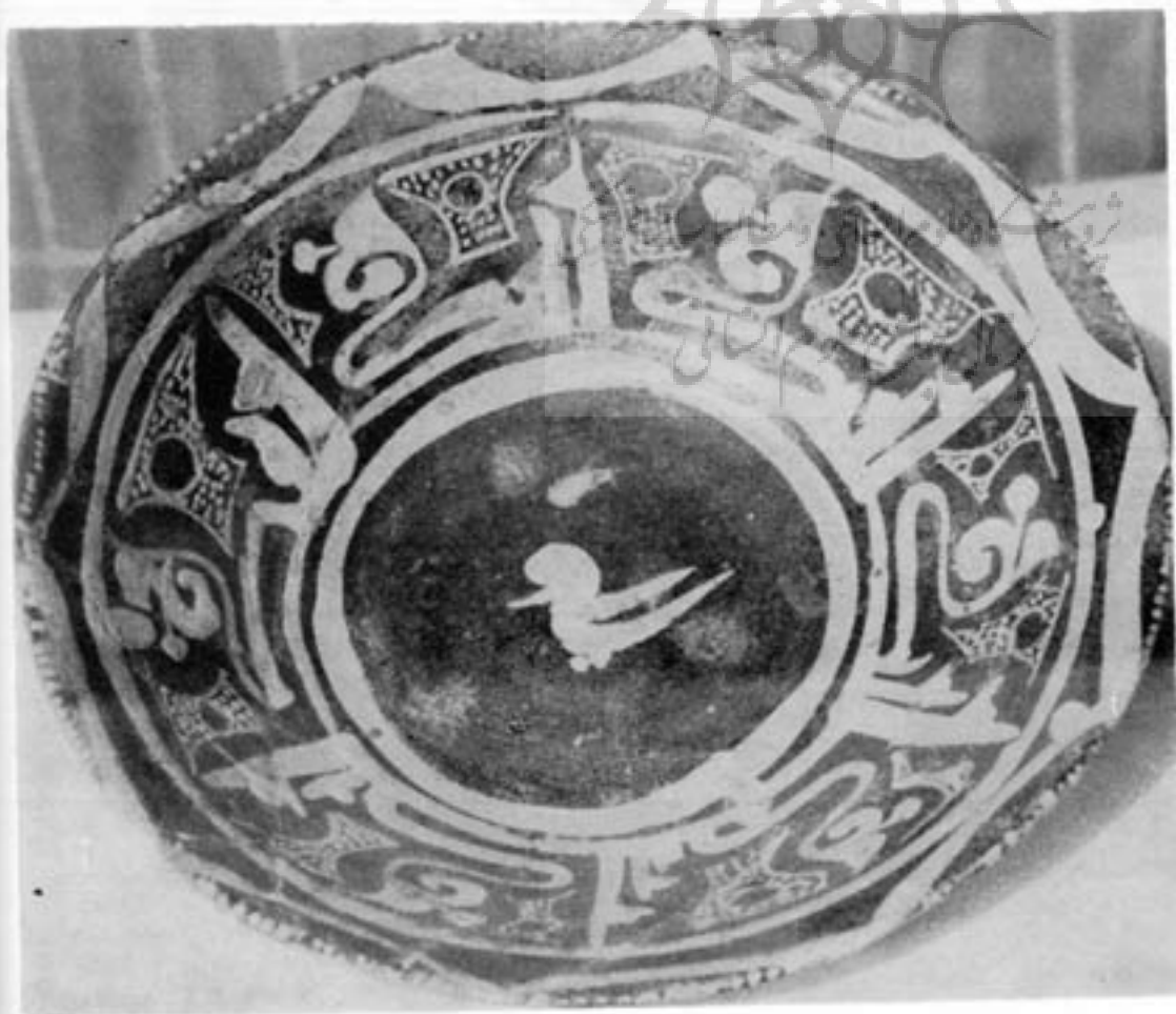
خطوط تزیینی بر بشقاب متعلق به قرن چهارم