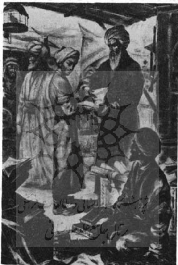
این سینا در کتابفروشی ( بخارا ) نقل از مطبوعات شوروی