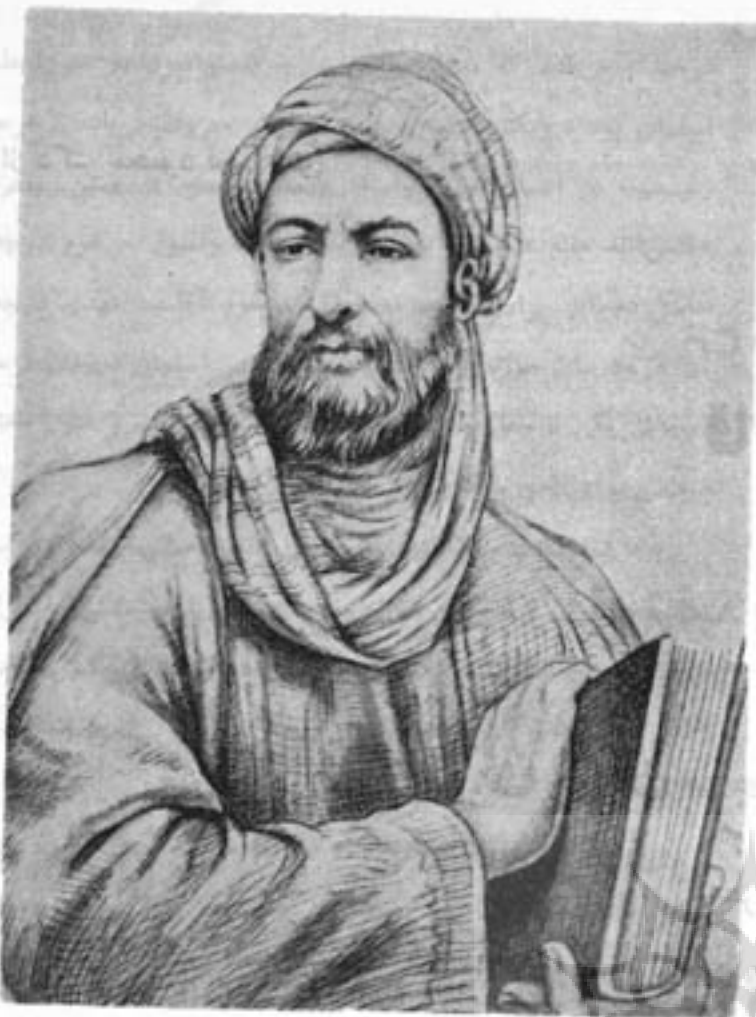
تصویر بوعلی - بنا که انجمن آثار ملی آنرا پذیرفته است