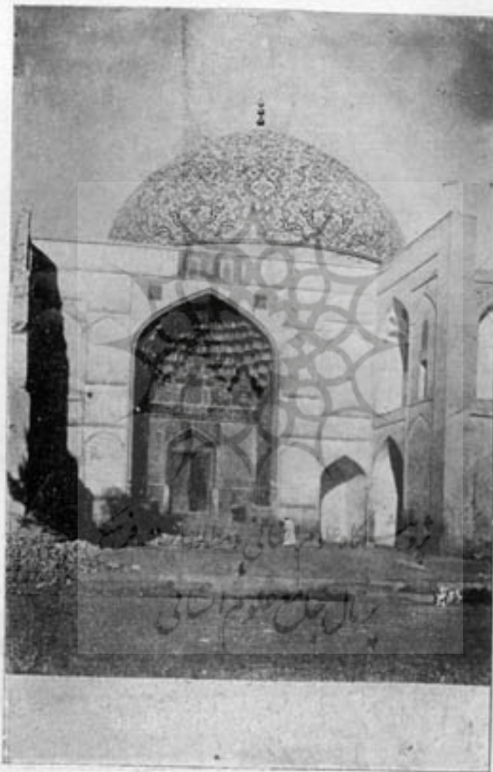
مسجد شیخ لطف الله - اصفهان

باشد پیشرفتهای مهمی در صنعت پیدا می شود علاوه چون دوره صفویه نسبتاً دوره آرامش و امنیت بود صنعتگران فرصتی بدست آورده و در حرفه خود گامهای مهمی برداشتند. اینیه زمان صفویه علاوه بر استحکام و عظمت در زیبایی و ظرافت نیز جالب توجه میباشند