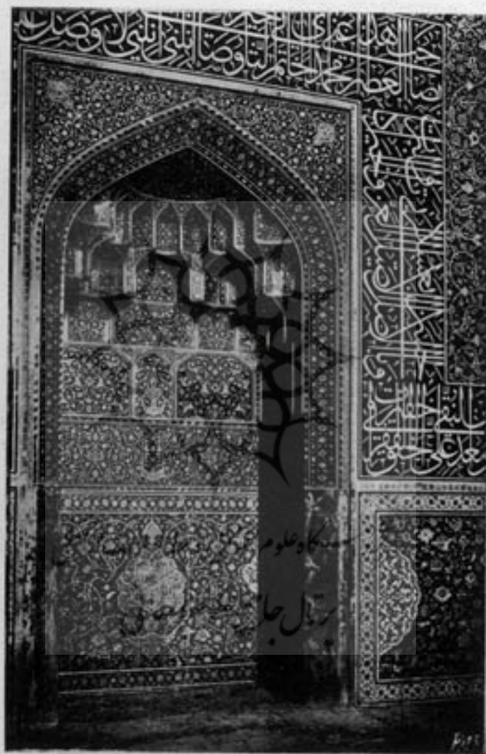
محراب مسجد شیخ لطف الله ( اصفهان )

نقاشی زمان صفویه که با اسلوب چینی آمیزش پیدا کرده بود از آن بیعد در ایران متداول گردید علت نفوذ اسلوب چینی در نقاشی ایران این بود که در آن ایام دو نفر نقاش بعنوان متخصص و استاد از چین استخدام شدند ولی بتدریج شاگردان از استادان خود سبقت گرفتند.