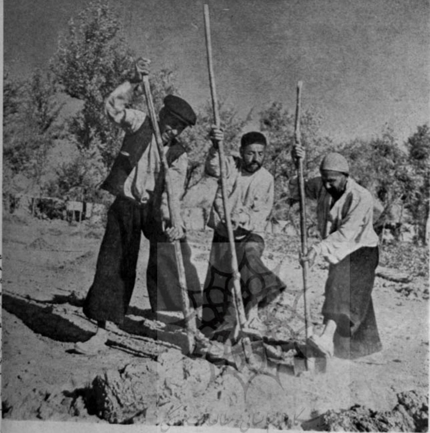
کشاورزان در حال کاشت زمین