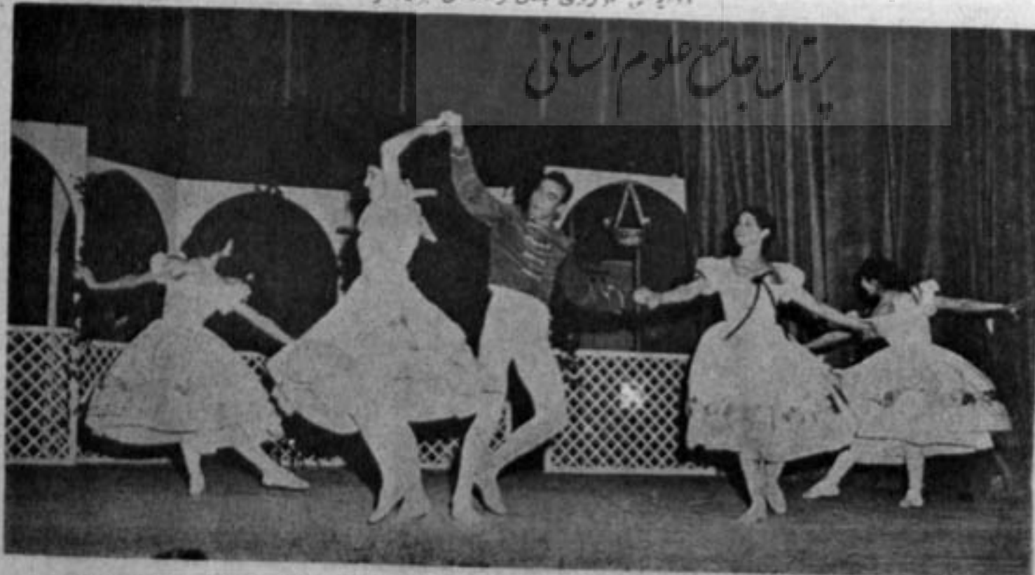
«میعاد ماه» رقص باله کلاسیکی که توسط تراورس کمپ روی والن اشتر اوس طراحی و توسط هنر جوان هنرستان ملی باله ایران اجرا شده است.

ریبو Ribot هنرشناس فرانسوی می‌گوید رقص مانند تمام هنرهای دیگر،