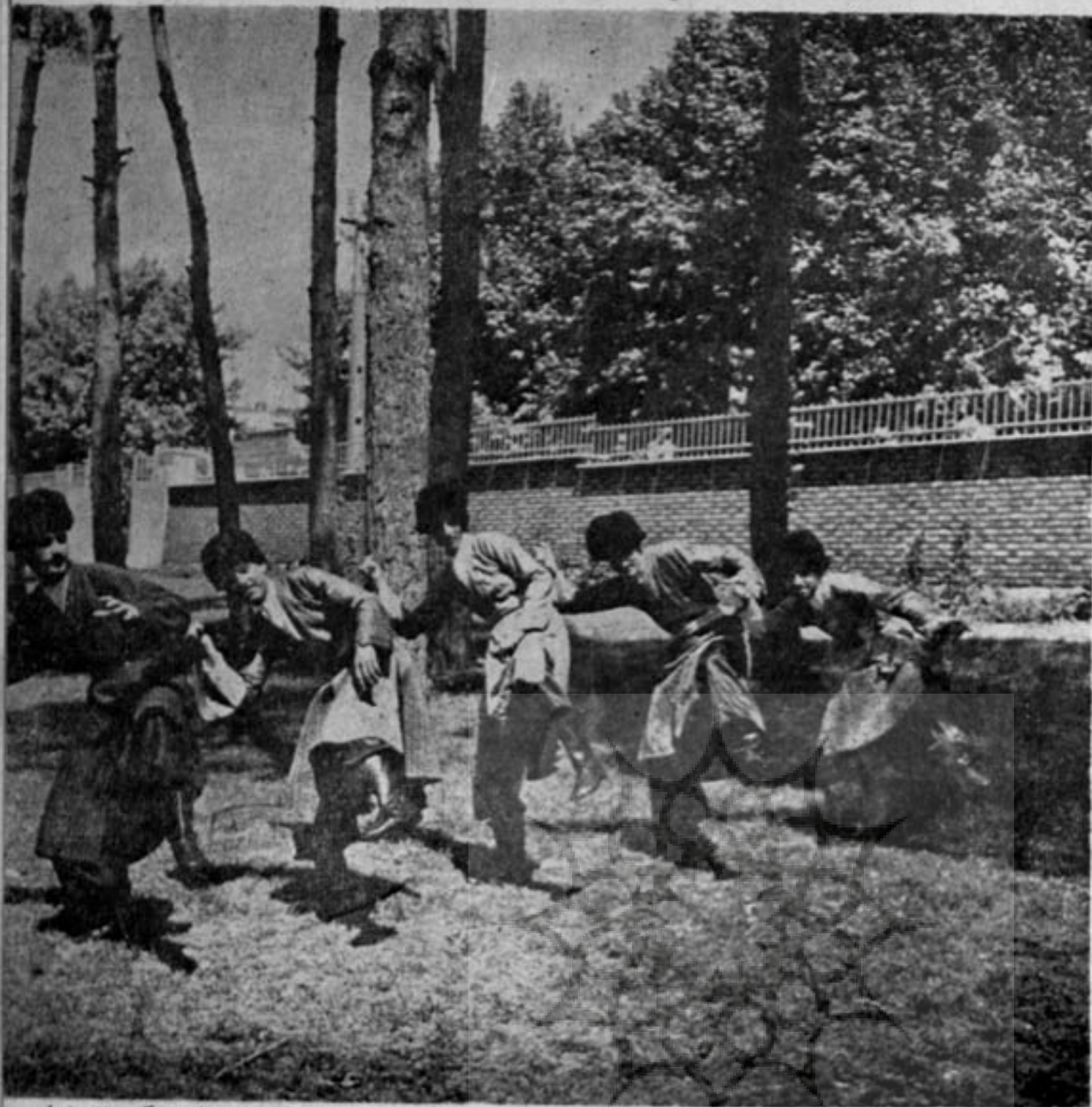
رقص های محلی از زیباترین و نشاط آورترین رقص های جامعه ما محسوب می شود. در این عکس هنرمندان گروه رقص های ملی و محلی در حین اجرای رقص ترکمنی دیده می شوند.

این نوع رقص بعدها منحصر به طبقه ورزشکاران شد و صرفاً در زورخانه های کشور ما به ترتیبی که