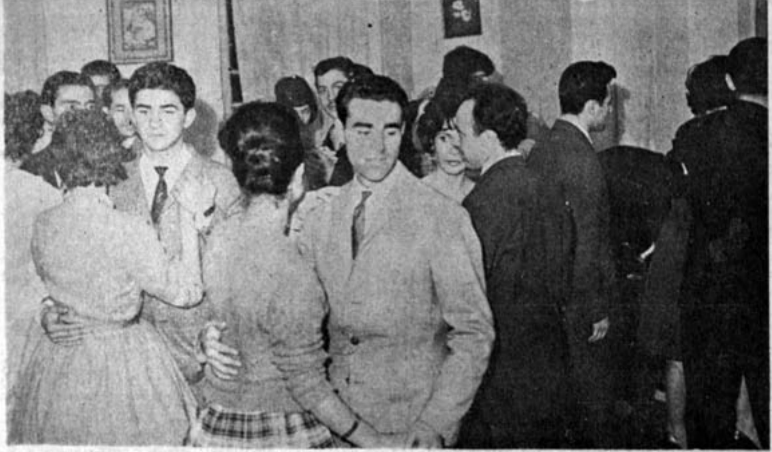
رقص های مدرن اروپائی در شهر ما طرفداران زیادی دارد.

از رقص های مدرن اروپائی که در شهر ما طرفداران بیشتری دارند میبایست رقص های تانگو - چاچاچا پاسادوبل-راک اند رول-سامبا-مامبو- والس و اخیرا چارلستون را نام برد.