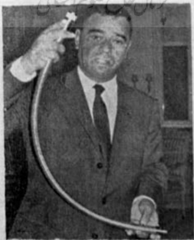
رتال علم باستان

لوله ای که در دست این آقای یئیندر استگاه معاینه و عکس برداری از داخل روده و معده است تا کتون اطباء قادر نبودند بدون عمل جراحی داخل بدن را تماشا کنند ولی بوسیله این لوله که از نوارهای نازک شیشه درست شده و دارای ذره بین قوی در قسمت جلو و یک شیشه مات در انتها میباشد این مشکل بزرگ علم طب نیز حل شد. مخترع سوئدی این دستگاه عقیده دارد که از این یعد میتواند معاینه دقیقتری از بیمار بعمل آورد.