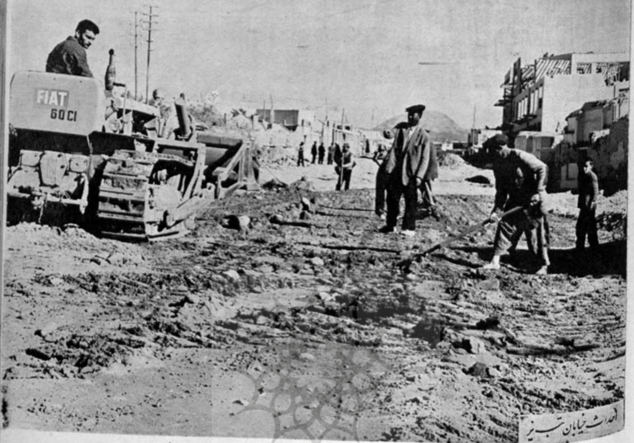
اهدای خیابان تبریز