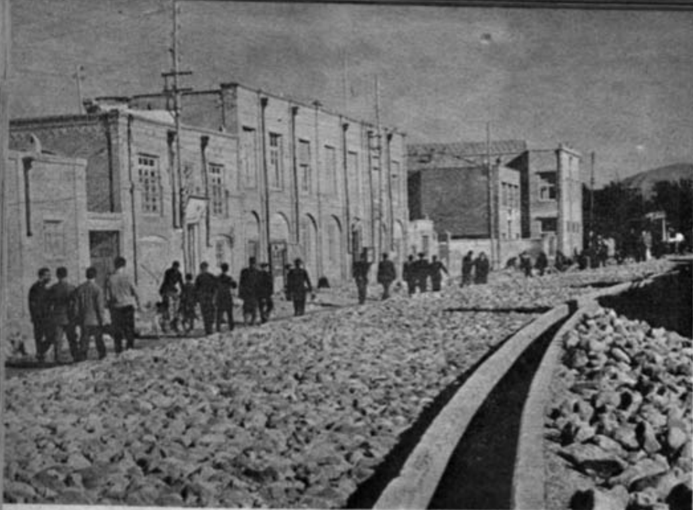
زیرسازی یکی از خیابانهای تبریز

«تبریز» بقول خود ترکها یا تبریز، اسم مرکز استان پهناور و پرجمعیت و حاصلخیزی است که در سمت شمال غربی ایران قرار دارد. این شهر را مخاطراهمیت جغرافیائی مرزی و قدمت تاریخی و شجاعت مردمش چشم و چراغ ایران نام نهاده‌اند.