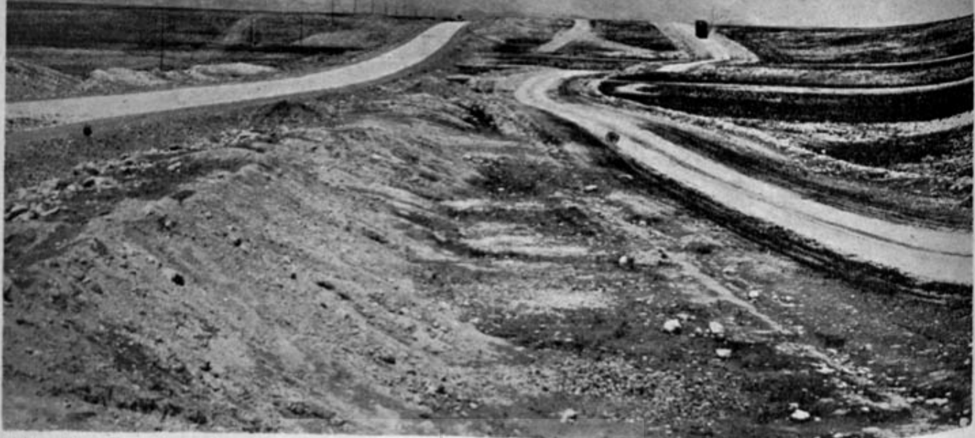
در نهضت راهسازی سالهای اخیر کمکهای بانک بین المللی نقش مؤثری داشته است

در برابر ۱۰۹ میلیون دلار سال پیش بوده است. ربح قرضه های طویل المدت کماکان در بازار بالا بوده و در نتیجه فرع قرضه های بانک از ۱/۶ تا ۱/۶ در یافت شده است.