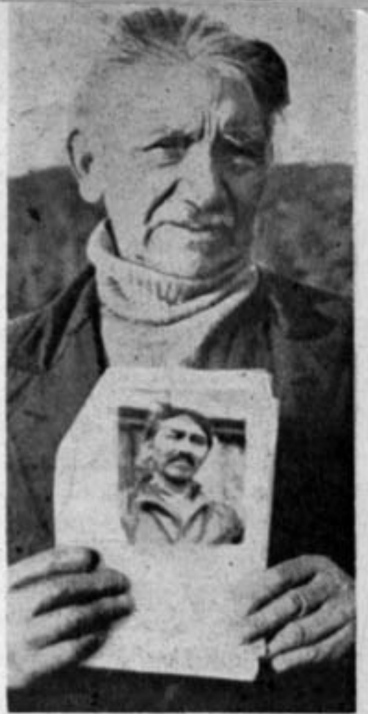
این مرد روستائی هنگام عکس برداشتن، تصویر جوانی خود را هم جلوی دوربین گرفت!