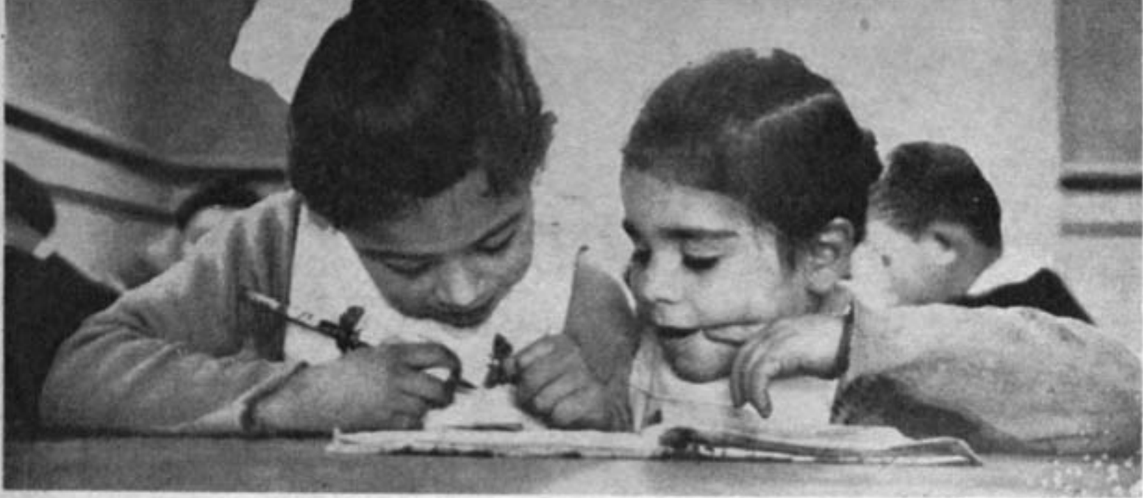
دو دختر دانش آموز از اهل شیلی - تعلیمات اجباری شیلی از سال ۱۹۲۸ در این کشور عملی شد و اکنون چهار پنجم افراد شهری شیلی سواد خواندن و نوشتن بلدند

خواستار بکلید نیست. متصدی دفتر گفت که احتیاج سیستم شرافتمندانه اداره میشود و شما نگران اثاثه خود نباشید در این هتل دزدی نمیشود.