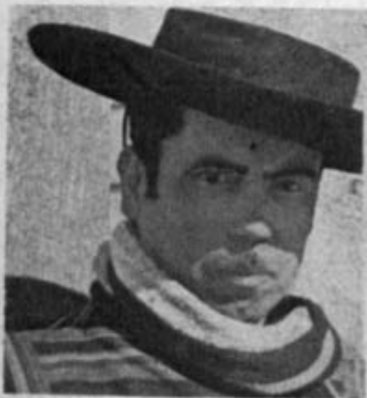
یک مورد نمونه از اهالی سانتیاگو