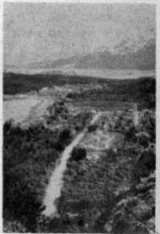
ارجله های «پاناگولیا»