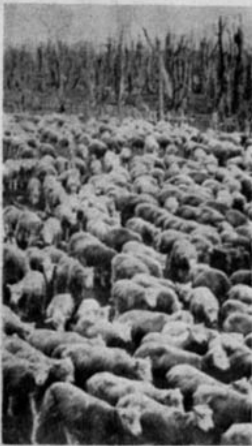
گروهی از گوسفندان «پوفتا»

راحتی مردم این کشور روی صمیمیت و حس دوستی است که نسبت بخود و خارجیان دارند.