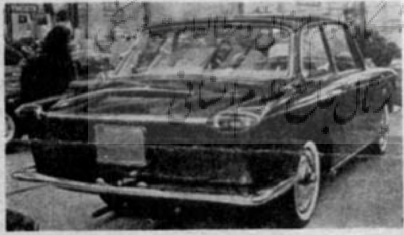
آخرین مدل فولکس واگن بشکلی است که در عکس ملاحظه میفرمایید، این مدل در بعضی از کشورهای اروپایی با عدم استقبال مواجه شده است و مخالفین میگویند شکل جدید فولکس واگن امتیاز اساسی آنرا از اتومبیلهای بزرگ آمریکائی فاقد است و در عین آنکه اصالت خود را از دست داده براه تقلید افتاده است.

مشاور باید بتواند خود را در وضع و موقعیت افرادی که در طبقات مختلف اجتماع ایران قرار گرفته اند بگذارد. باید مواظب باشد که رفتار و گفتار او به وجه جنبه خرد گیری و حتی تعجب نداشته باشد و باید در همه حال بسا اندازه کافی ظرفیت معنوی داشته باشد و بتواند هر نوع شکفتی را بدون سبزه در سخاوت درک و قبول نماید. کار مشاور در باب مناسبات انسانی يك مبارزه دائمی است. تنها آگاهی بشری بتنهائی کافی نیست. باید بر احساسات و عواطف خود آن اندازه تسلط داشته باشد که بتواند يك ارتباط معقول و دوستانه با ایرانیان برقرار نماید بدون اینکه این دوستی و صمیمیت از حد اعتدال خارج شده و باعث اختلال و تعویق کارهای اداری شود. رفتار او باید منعکس کننده احترام او نسبت بهمکارانش و ایمان و