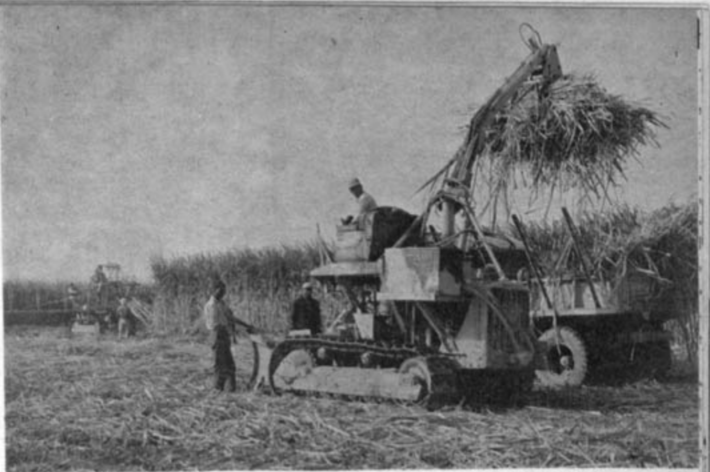
معرفی طرز بکار انداختن يك ماشين از مراحل است كه مشاور با همكار تماس فزديك دارد

مؤسسات ذينفع ايراني دارد بلکه هست بوجود همکاري کامل بين گروههاي مشاورتي کونا کون در ايران نيز ميباشد. بنا بر اين هر مشاور ملزم است که يس از ورود بايران از کليه هدهدها و اقدامات و فعاليتهاي که ساير مشاورين خارجي در زمان گذشته و ياد حال حاضر در ايران انجام داده و يا ميدهند آگاهي کامل حاصل نمايد. يك مشاور ميبايست از مسؤليههاي چند گانه واحيانا متضاد يکديگر در مقابل موسسه متقاضی- سفارت و يا کنسولگري خود و يامؤسسات ايراني برعهده دارد کاملاً مطلع باشد.