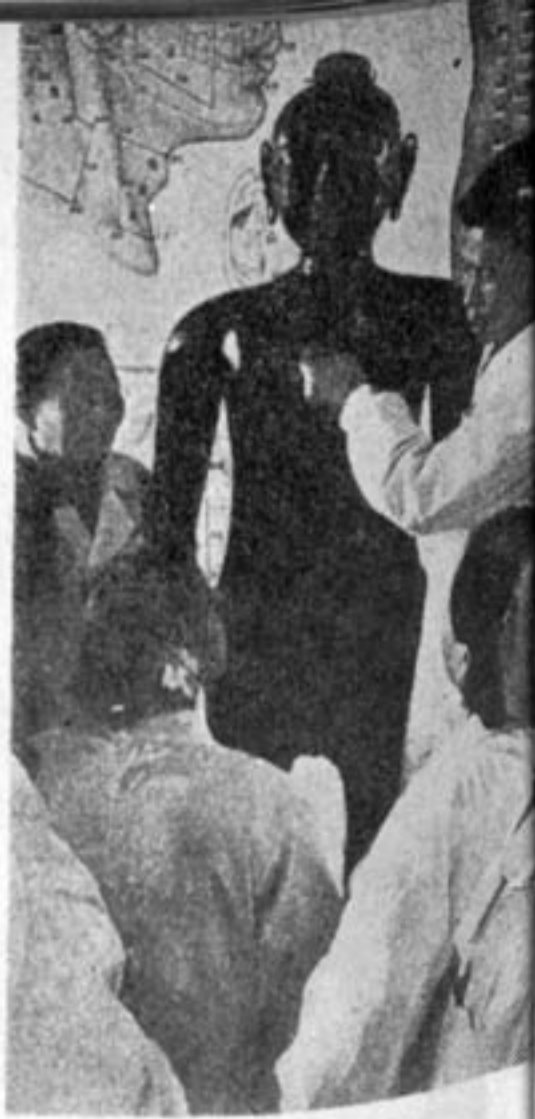
درد انشکده‌های پزشکی بکمک مجسمه های مومی طرز درمان با سوزن را بدانشجویان تعلیم میدهند

مفصل تر، ولی بدون تغییرات عمده اساسی، در اختیار علاقمندان میگذازد. فقط بجای عوامل این ویانک، در کتاب جدید از اصطلاحات سیستم یاراسه پاتیک و سوماتیک استفاده شده و باین طریق فیزیولوژی جدید و طب کهن را درهم آمیخته اند.