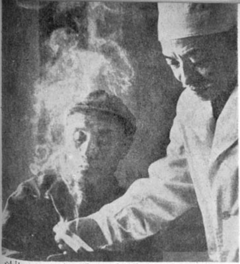
علاوه بر سوزن، پزشکان چینی بکمک یکتوع «سیگار» های مخصوص و اثرات حرارتی و بخارات آنها بعضی از روماتیسم‌های مفاصل را معالجه میکنند

این پزشک هنگامیکه پای یک بیمار مبتلا بدرد کلیه را با «کالوانومتر» معاینه می‌کرد، متوجه شد که بعضی نقاط پای بیمار مقاومت الکتریکی کمتری دارند و این نقاط متضاد قدرت روی «مدار کلیه» روش درمانی با سوزن قرار داد. این کشف سرو صدای زیادی میان متخصصین