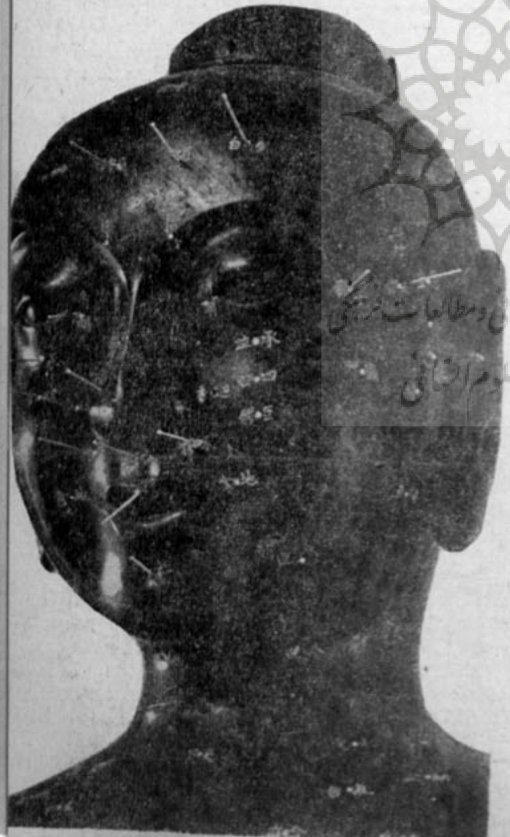
مجسمه برقری قرن ۱۲، مخصوص نمایش طرز معالجه با سوزن در دانشگاه چین

«سرفه کنید. بعد، در حالیکه زن جوان سرفه میکند، پزشک چند سوزن طلا و تهره‌ای را با چابکی و مهارت بسرعت در چند نقطه در امتداد ستون فقرات او فرو میکند. این سوزنها معمولاً دو سانتیمتر و نیم طول و شش تا هشت دهم میلی‌متر قطر دارند و در واقع تمام دستگاہ و تجهیزات درمانی این روش معالجه عبارتست از تعدادی از این سوزنها!»