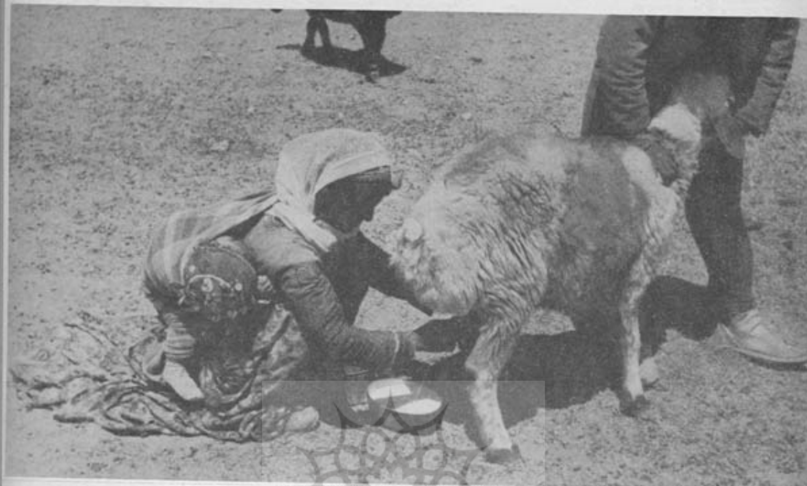
دوشیدن دامها از وظائف مهم زنان ایلات بشمار میرود