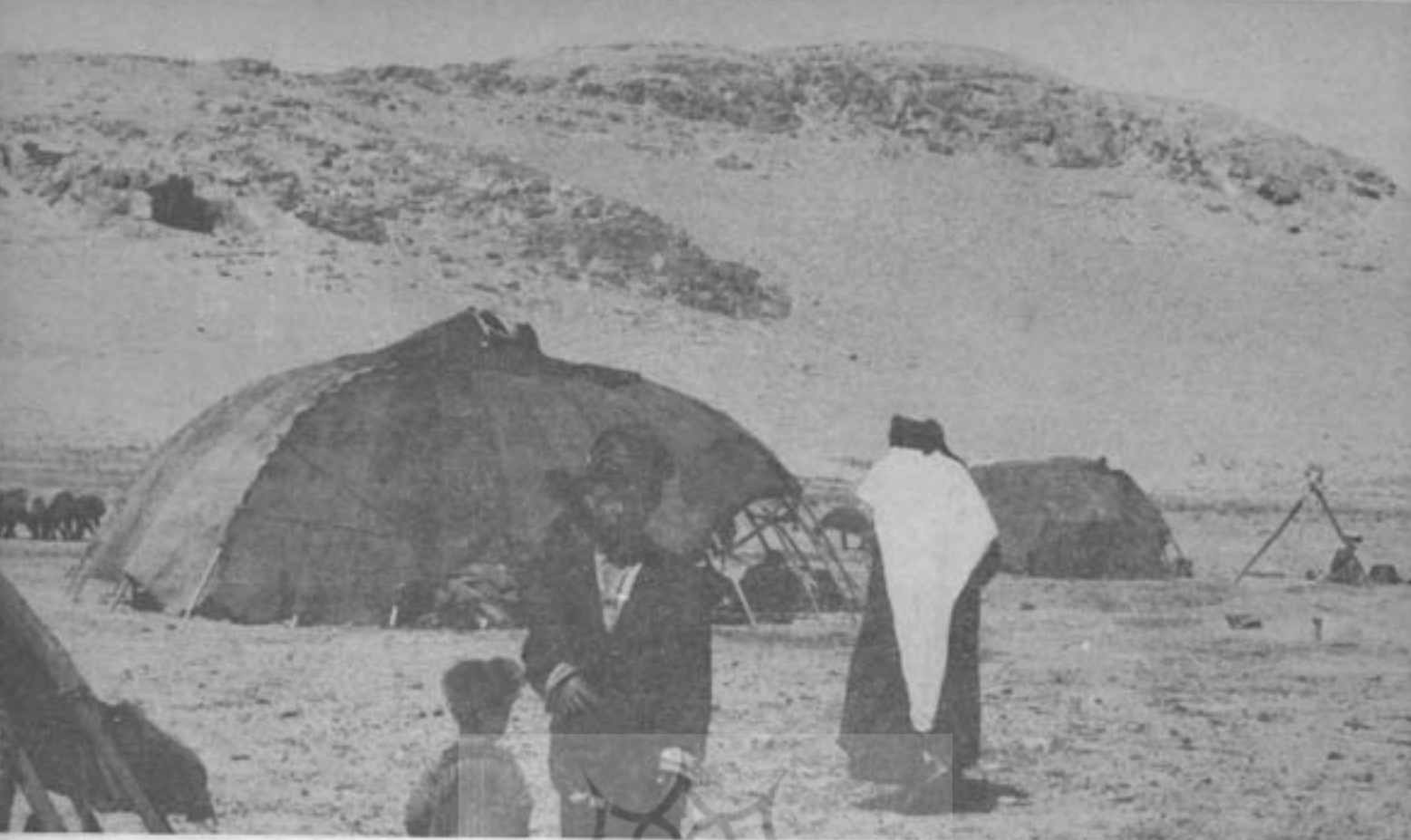
نونه‌ای از زندگانی ایل شاهسون در میان‌دوآب و فوج چادر آنها

هر ایل در سرزمین محدودی زندگی میکند که بر اصل آداب و سنت و قراردادهای دیرین و قدیمی بآنها استوار است. زمینهایی که عشایر در اختیار دارند از دو منطقه گرمسیری و سردسیری تشکیل گردیده است، محل گرمسیر برای زندگی زمستانه که اکثر آن در مناطق جلگه‌ای و دره‌های محفوظ و سردسیر برای زندگی تابستانه که مناطق کوهستانی و مرتفعات را تشکیل میدهند مورد استفاده قرار میگیرد و این عمل را بیلاق و قشلاق کردن نیز میگویند که ازدو لغت ترکی تشکیل گردیده است بطوریکه بیلاق یعنی تابستانه و ازلفت یای یعنی تابستانه گرفته شده و قشلاق که بمعنی زمستانه است ازلفت قش بمعنی زمستانه گرفته شده است.