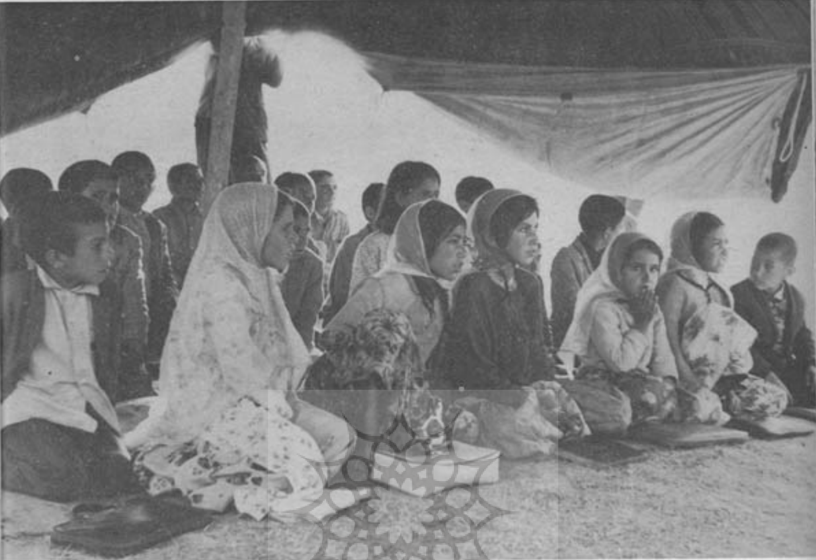
کلاس درس ایلی قتلانی

و این امر بواسطه کوچ ایلات است و زمینهای آبی که مواظبت بیشتری لازم دارد، کمتر در اختیار افراد ساکن و تخته قابو، میباشد. بهترین و ارزاترین مبارزه با فرسایش خاک در مناطق دیبزار و ایلات ایران بوجود آوردن مراتع مصنوعی بتوسط وجود ایلات است که با نظارت کامل سازمانهای مسئول مانند وزارت کشاورزی و اصلاحات ارضی باین کار مبادرت نمایند. البته این احتمال وجود دارد که توسعه زمینهای زیر کشت در مناطق نفوذ عشایر کمک شایانی به اسکان عشایر بنماید زیرا بر اثر از بین رفتن مراتع بعنوان توسعه زمینهای کشت مطلقاً دامها دچار کمبود علوفه شده و ایلات ناچارند زندگی کشاورزی