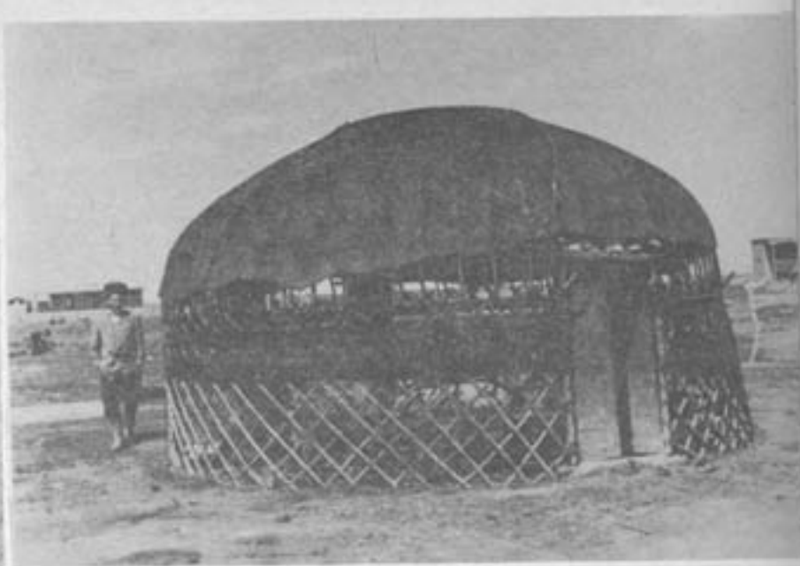
نمونه‌ای از چادرهای ترکمنها که در اصطلاح محل بنام آلاچیق معروف است