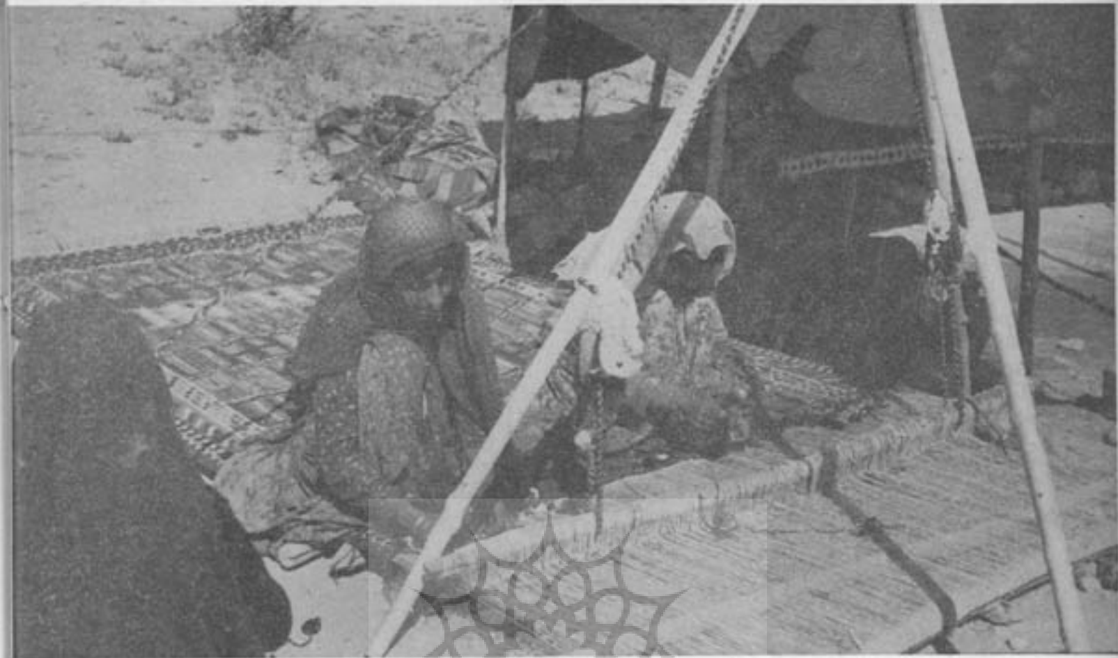
قای و گلیم‌بافی از کارهای دستی و مهم و پردرآمد ایلات ایران است

شاید عامل دیگری نیز در اسکان این افراد مؤثر باشد و آن دست‌کشیدن از اقتصاد متزلزل دامداری و با گذاشتن به اقتصاد ثابت و استوار کشاورزی است. و با اینکه با اسکان خویش