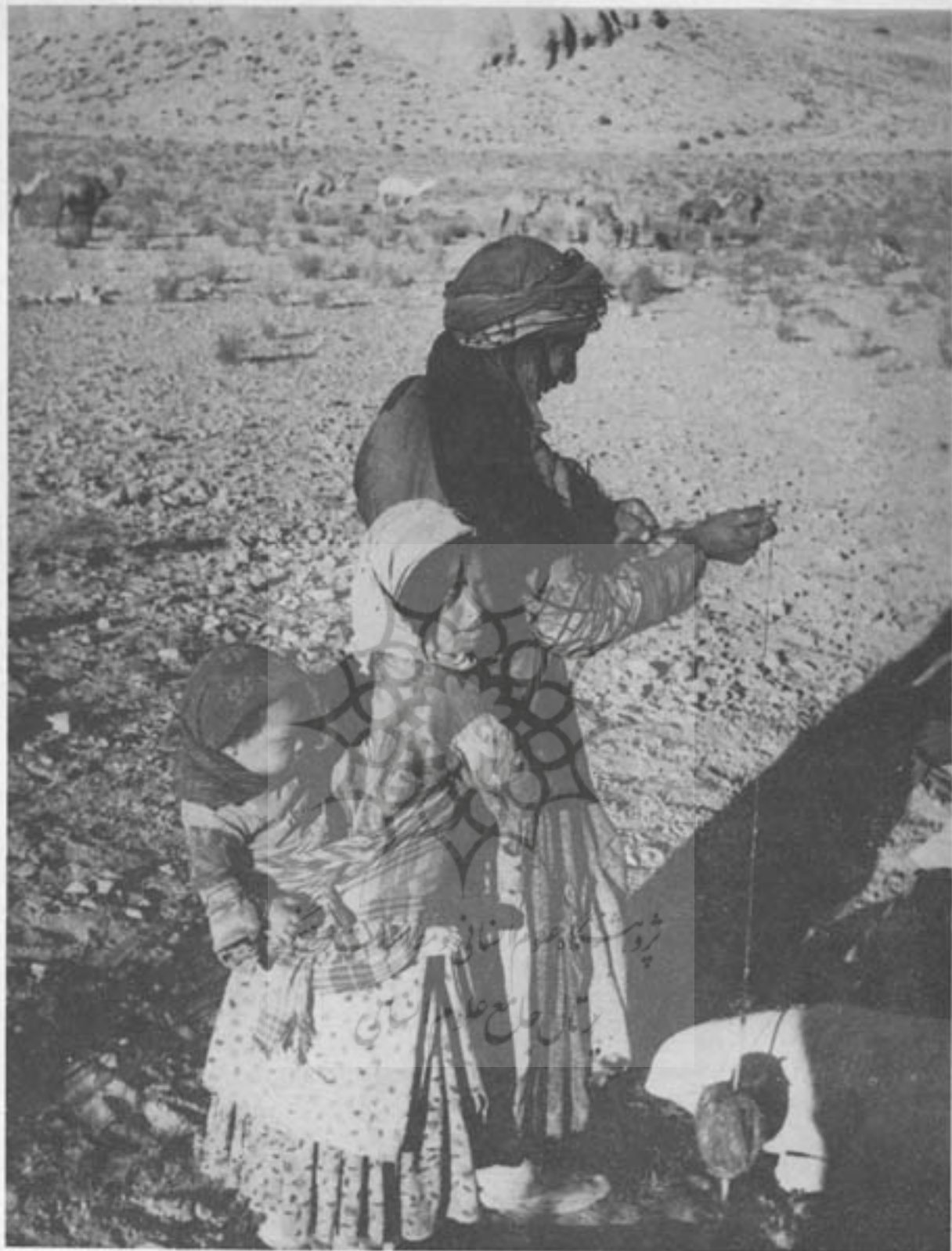
نخ‌ریسی و بچهداری بعد از انجام کار روزانه از مشاغل تقریبی ایلات ایران است