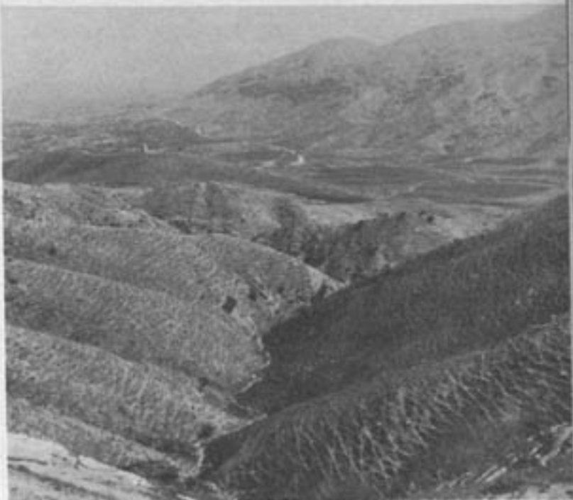
مزارع رشته کوههای زاگروس در جنوب شیراز که بر اثر چریدن و راه رفتن دامها پدیده فرسایش خاک را موجب گردیده است

کشید و بدامپروری اینتتریف مسادرت خواهند کرد، از اختصاصات این زندگانی وجود مسکن دائمی برای افراد و استفاده دام آنها از طولبه در فصل زمستان و بهره برداری از چراگاههای مناطق مرتفع توسط عده معدودی چوپان میباشد و بنابر این دیگر احتیاجی به کوچ کردن تمام افراد ایل نخواهد بود. این نوع زندگی را میتوان با اقتصاد ترانس هومانس ۲ در ممالک بالکان مقایسه کنیم.