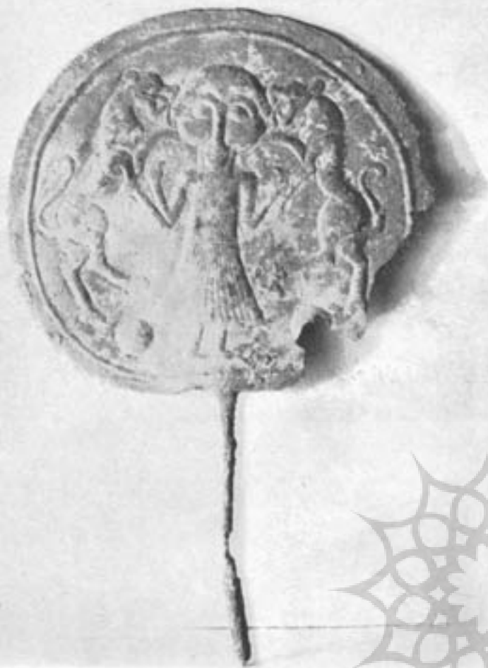
سنگ مرمری با نقش خدای حیوانات گیلگمش - اواخر هزاره دوم اوایل هزاره اول ق. م.

لیکن از آغاز هزاره دوم قبل از میلاد اقوام دره‌های مجاور شرق و مغرب سرعت سیر تکامل و ترقی را پیمودند با جلگه بین‌النهرین تنها از راه جنگ و ستیز نبود بلکه عامل مهم تعیین‌کننده موقعیت ممتاز طبیعی و جغرافیائی دره‌های حاملخیز زاگرس بشمار میرفت. کلیه امته تجارتم و کاروانهای حامل بار و کالا اجباراً از این منطقه عبور میکرد گواينکه اینان دشمن موروثی دولتهای بین‌النهرین محسوب میشدند باوجود این ناچار بودند که با آنان دادوستد کنند و در همین گیرودار بود که تحت تأثیر همسایگان متمدن‌تر از خود قرار گرفتند.