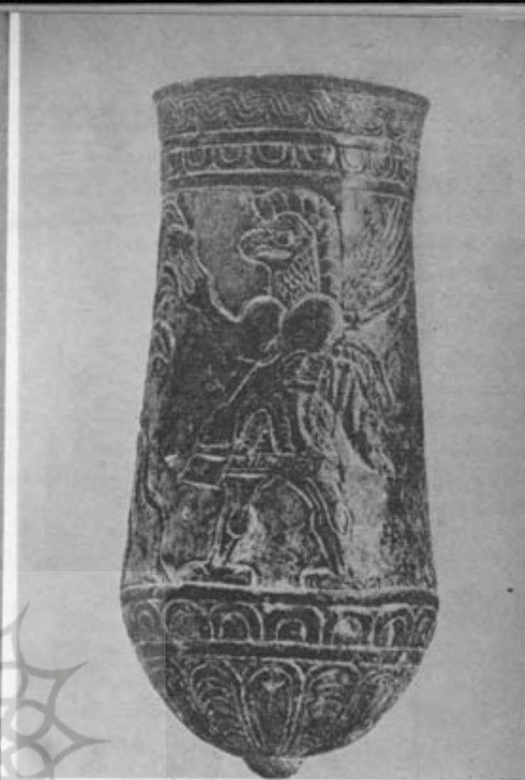
ساجر مفرشی منتوش اواخر هزاره دوم ق. م.