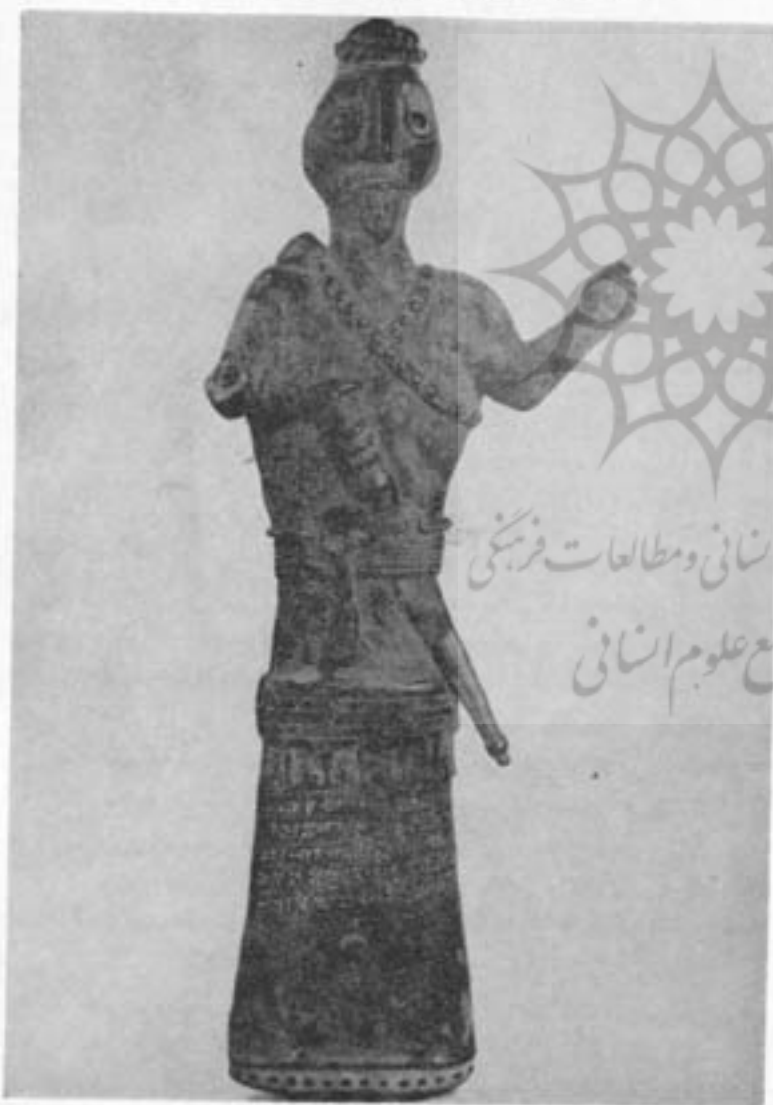
مجسمه انسان مفرغی با کتیبه میخی ۱۰۰۰ تا ۷۰۰ ق. م.