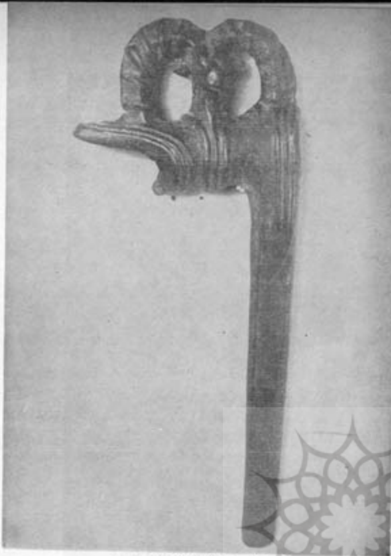
تیر مفرشی - اواخر هزاره دوم ق. م.