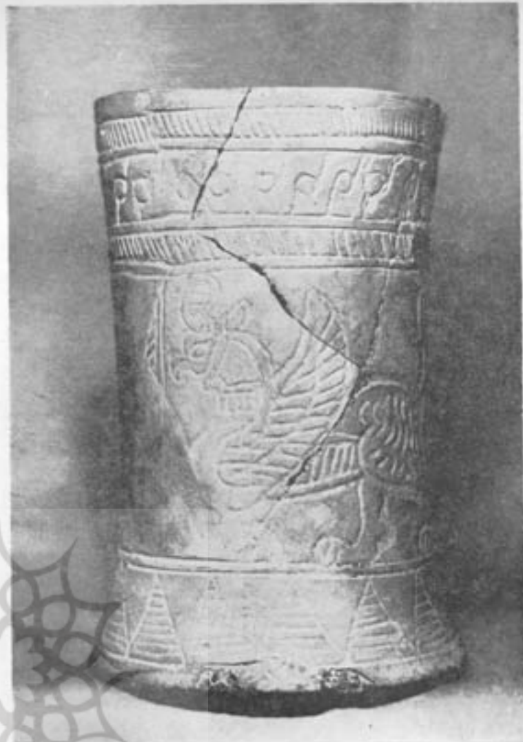
لیوان سفالی نقوش . لرستان ۱۰۰۰ تا ۷۰۰ ق . م .

معلوم نیست کاسیان از چه وقت در این نواحی ساکن شدند آنچه مسلم است قوم مزبور از آغاز هزاره سوم قبل از میلاد در اینجا مستقر بوده‌اند و در حدود ۱۷۰۰ قبل از میلاد بدره رودخانه دیاله نفوذ کرده و از همین زمان در عرصه تاریخ مشرق قدیم وارد شدند زیرا مدارک تاریخی نشان می‌دهد که از این دوره به همسایگان خود مخصوصاً بابل دستبردهائی میزدند. اهلی کردن اسب را بکاسیان نسبت می‌دهند گویانکه از زمانهای بسیار قدیم اقوام آسیای میانه از وجود اسب مطلع بودند.