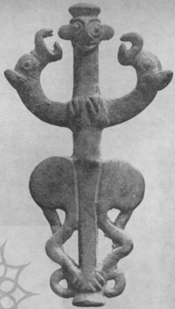
بت مغربی - هزاره دوم ق. م. لرستان

ایران با آب و هوای گوناگون و دره‌های عمیق و حاصلخیز شبیه مثلثی است که میان خلیج فارس و دریای خزر قرار دارد و کوههای بلندی آن را احاطه کرده است. کوهستانهای مذکور چون دیواری گرداگرد فرورفتگی مرکزی را که در حال حاضر بیابان خشک و بی‌آب و گیاهی میباشد و در اصل دریای بزرگی بوده و یادگاری از دوران باران ۲ است فراگرفته، در این عصر