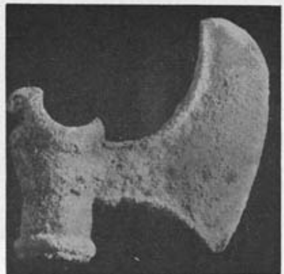
۶ - شوش - تبر مغرغی پیداشده در تابوت عیلامیان - مردگان را در خانه‌های خویش با افزارهای متعلق به ایشان به خاک می‌سپردند. زنان را با آلات آرایش و ابزارهای گرانبها و مردان را با سلاحهایشان ۷ - شوش - ارك - در میان میخهای آجری میخی با نام پادشاهی که در سدهٔ بیست و دوم پیش از میلاد می‌زیست پیدا شد. این میخ تاریخ بنای این دیوار را معین کرد

می‌سپردند. عیلامیان مردمی بودند که نسامی بودند و نه هندو اروپایی. در این محوطهٔ جدید چند تابوت سفالین پیدا شد درست به شکل وان حمام (شکل ۴) بر من آشکار است که این تابوتها روزگاری جای استحمام بوده است. در هر تابوتی مرده‌ای قرار داشت که به حالت جنینی که در شکم مادر باشد دست و پایش را در شکم جمع کرده بود و الا پاها در آن ظرف تنگ جای نمی‌گرفت. این وان حمام يك زیر آب هم دارد.