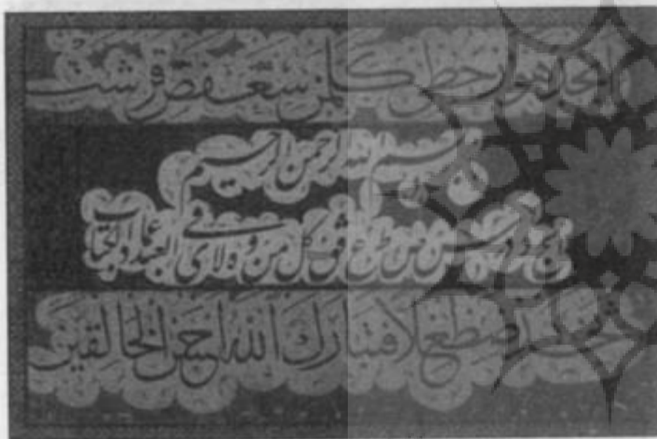
تصویری از یکی از صفحات رسم‌المشق چاپ شده در ایران

یکصد سال پیش زمانی که انقلاب مردمی و خود جوش مشروطه به ثمر رسید بسیاری از کسانی که دل در گرو آزادی داشتند از جمله هنرمندان، شاعران و نویسندگان به وادی سیاست کشیده شدند و از این رهگذر هم خدمت‌ها کردند و هم رنج‌ها بردند. از سوی دیگر در آغاز مسیر همین مردم و نیز سیاستمدارانی که به گرد مجلس شورا و دستگاه قضا آمده بودند خود به درستی ساز و کار این دو نهاد را نمی‌شناختند و چه بسا در اثر ندانم کاری به بیراهه می‌رفتند. همچنین ارتباطات خاص که امروزه با عنوان پارتی شناخته می‌شوند در نتیجه دادخواهی مؤثر بوده است. مقاله حاضر به معرفی یکی از نمونه‌های هنرمندان برجسته اهل مشروطه که به سیاست گرایید یعنی عمادالکتاب و پرونده‌ای در خصوص یکی از آثار او می‌پردازد که می‌تواند تا حدودی حال و هوای مردم، هنرمندان، دلتمردان، اهل مجلس و دست‌اندرکاران دستگاه قضا را نشان دهد.