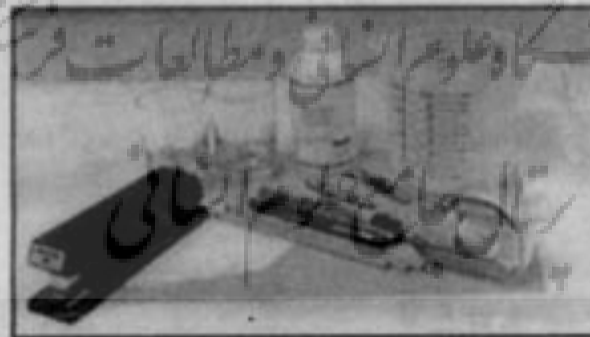
الف: وسایل مورد استفاده در کروماتوگرافی