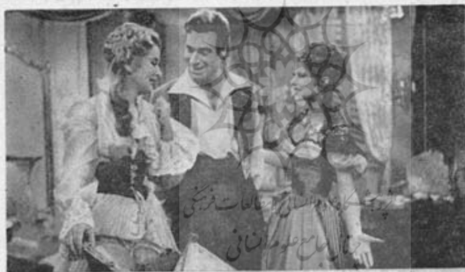
«عروسی فیگارو» اثر موزار - تنظیم برای تلویزیون

بخش يك اپرا مستقیماً از اپرای شهر، مشکلاتی در بردارد که کوشش کارگردانرا عقیم میکند. بزرگترین مشکل، روشنایی است. نوری که در اپرا مورد استفاده قرار میگیرد فقط جهت روشن ساختن صحنه اپراست. و این روشنایی جهت