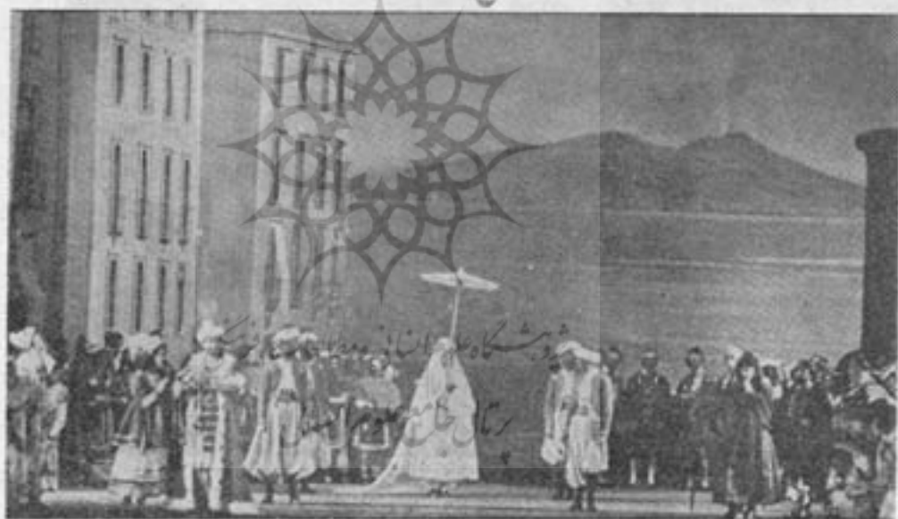
« ایتالیایی در الجزیره » اثر روسینی - فستیوال شهر « گلیندبورن »

موضوع رابطه رهبر ارکستر با خوانندگان یکی از موانع مهم «بخش مستقیم از استودیو» میباشد. چون از صحنه‌ها غالباً از روپرو فیلمبرداری میشود، ارکستر ناگزیر در بالکن یا در گوشه‌ای از استودیو جای میگیرد. در این مکان خوانندگان بندرت قادرند اشارات رهبر ارکستر را ببینند. در استودیوهای نوینی که برای رفع این نقیصه ساختمان شده، ارکستر مانند جای خود در تالار اپرا، در گودی جلوی صحنه قرار میگیرد.