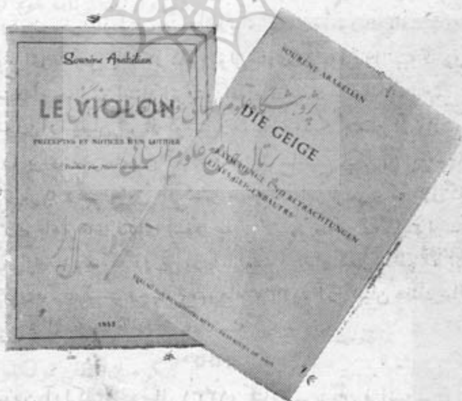
نسخه اصلی کتاب ویولن بفرانسه و ترجمه اش به آلمانی

از جمله در یک « فرهنگ بین المللی ساز سازان » که در بروکسل