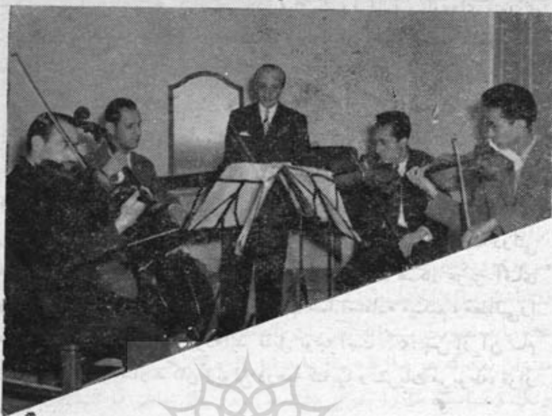
سرپرست يك «كوارتت» در هنرستان عالی موسیقی