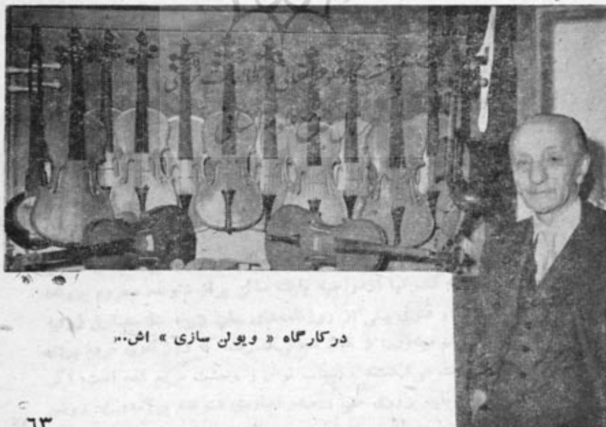
در کارگاه «ویولن سازی» اش..»

ماده اولیه برای ساختن ساز در ایران بفرآوری در دسترس است و آن