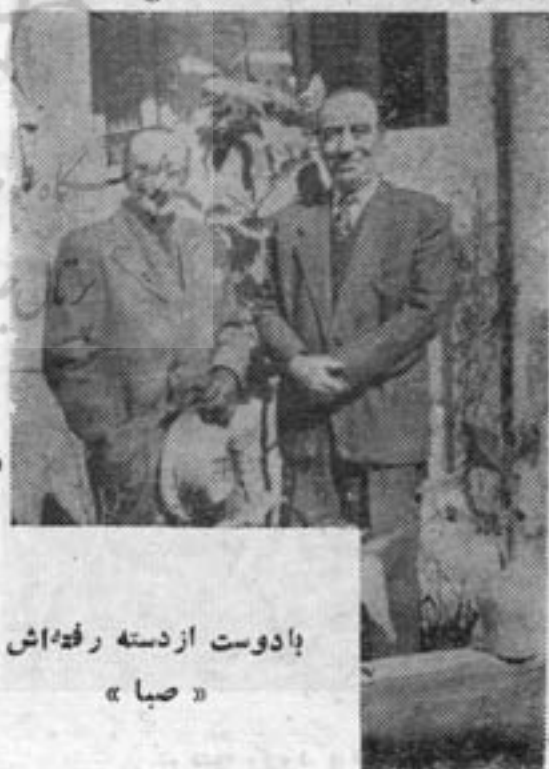
پادوست از دسته رفیق اش « صبا »

در سال ۱۳۳۵، آرا کلیان خود مصمم شد به آلمان سفر کند و بدعوت کنگره بین المللی فولکلور موسیقی در جلسات آن شرکت جوید.