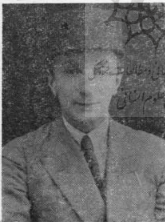
در بدو ورود به خدمت

با زوی کار آمدن « مین باشیان » تصمیم جدیدی بمرحله اجرا درآمد . چه که وی نقشه های فراوان و