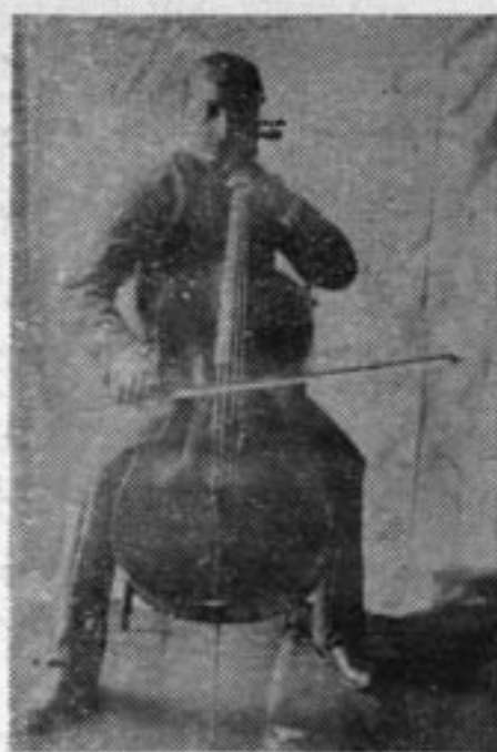
در ابتدای راه ...

استعداد اولیه سورن در کنسرواتوار تفلیس شگرف و چشم-گیر بود و از استاد مجرب و کار-آزموده‌اش این توصیه را دریافت، که به پراگ برود و استعداد و قریحه شایان خود را در آنجا، صیقل دهد. در پراگ به تکنیک ساز انتخابی خود - ویولن سل - آشنا تر شد و دستی توانا بر آن یافت. اولین ثمره تلاش‌های تحصیلی سورن، در «کوارتت»ی که با همکاری دوستانش برپا شده بود، بروز کرد، «کوارتت» سورن و دوستان، در کنسرواتوار پراگ تا سه سال فعالیت داشت و برنامه‌های