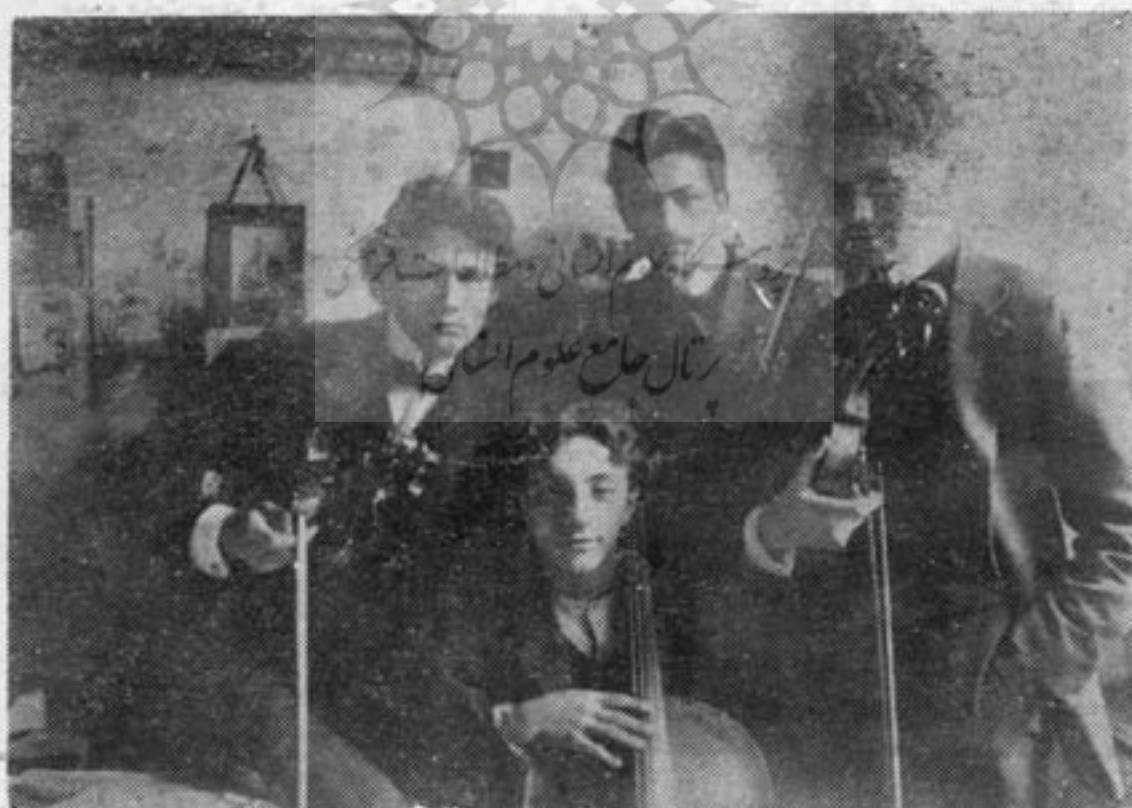
عضو يك «کوارتت» در پراگ