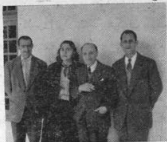
در کلاس «همنوازی»

مرتب و جالبی بدوستانان عرضه مینمود . در پراك استعداد سورن براه دیگری نیز معطوف شد . « کارل دورژاک » ، استاد ویولن - سازی - و از نسب آنتون دورژاک آهنگساز بزرگ - استادی وی را پذیرفت و در اندک زمانی باقنون ورموز ساختن و پرداختن ویولن ، آشنایش ساخت .