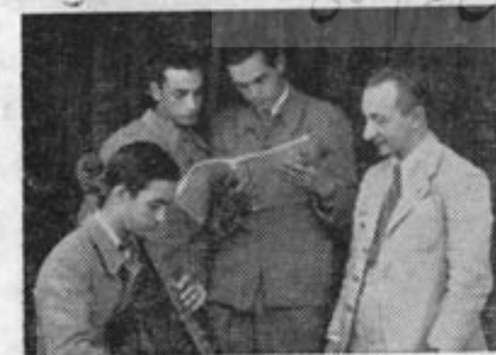
و در کلاس «ویولنسل»

پس از این سفر یکساله ، سورن دوباره به ادسا بازگشت و به تکمیل معلومات حقوقی خود پرداخت ؛ و هرگز جای شگفتی نیست ، تجربه‌ها بدو آموخته بود که با همه جنجالها و قال و مقال‌ها که در دنیا بر سر هنر برپاست ، هرگز آنرا یارائی نیست که همه مسئولیت‌ها را تحمل نماید و همه زندگی‌ها را تأمین سازد ؛ و این دنیای پر اضطراب و دغدغه طبیعتاً از یک پزشک و یا مرد حقوقی بیشتر استقبال میکند تا یک هنرمند با همه ارج و منزلتش ؛