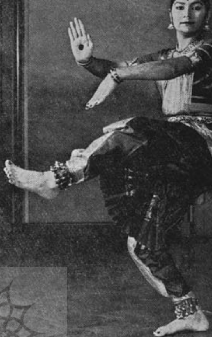
نمونه‌ای از رقص « بهارا نا تيام »

لطائف این عشق را تفهیم کند، علیهذا رقص و موسیقی هر دو بموازات یکدیگر حالات تجربیدی خود را حفظ کرده و هدف مشترک آنها یکی است.