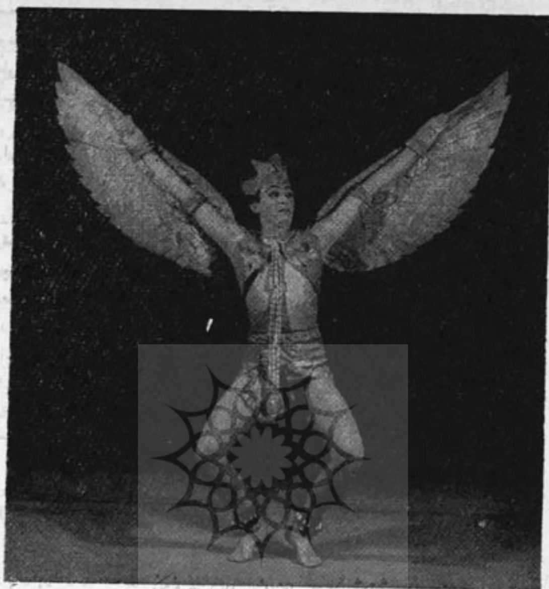
« عقاب زرین » یکی از بااله کلاسیک‌های اساطیری هند

عمومی رقص و مخصوصاً جنبه شوق‌انگیز آنرا در نظر دارند و روی آنها اثر میگذارد. رقصهای کاتاک انحصاراً درید قدرت زنانست و میان رقص‌های هندی ظرافت خاصی دارد.