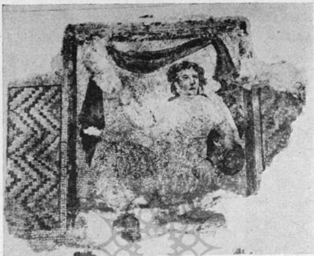
شکل ۱ - نقش موزائیک بانوی عهد ساسانی متعلق به کاخ شاپور اول در حال نشسته و بر بالش تکیه کرده و بادزن در دست. غرفه ساسانی، موزه ایران باستان

درباره آنها بوسیله دانشمندان ایرانی و غیر ایرانی نوشته شده است و گفتگو درباره آن از موضوع بحث در این مقاله بیرون است .