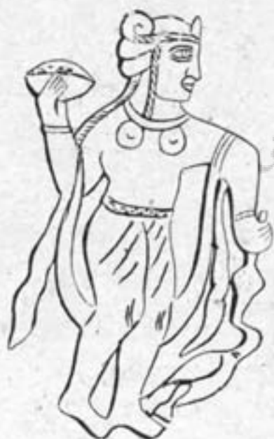
ش ۱۹ - بانوی رامشگر عهد ساسانی با ظرف دانه و قرقاول

جام سوم کوچکتر از دو جام سابق الذکر بوده (بقطره دایره ۲۱/۵ سانتیمتر) مشتمل بر چهار نقش است که کار آنها را ناتمام گذارده اند. یکی از این نقوش تصویر بانوی رامشگر را در حال نواختن بر بطن نشان میدهد. در تصویر دیگر بحال نواختن سرنائی که يك طرف بدنه آن برجستگی هائی وجود دارد دیده میشود (ش ۱۷). در تصویر دیگر طاوسی روی دست چپ و ظرفی دسته دار شبیه یغلاوی بدست راست گرفته است (ش ۱۸) و در تصویر