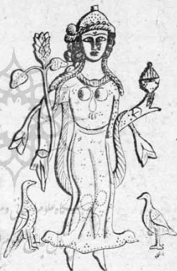
ش ۷ - طرح رامشگر عهد ساسانی باشاخ گل و بنخوردان

یکی از این چهار ظرف ، تنگ نقره بسیار زیبایی است ۱ که بر چهار سمت آن چهار حالت گوناگون بانوئی هنرپیشه را در حین رقص مینمایاند. در یک حالت شاخه گلی در دست راست و ظرفی که تصور میرود محتوی دانه های میوه میباشد بر دست چپ گرفته است (ش ۵) در دو طرف وی روباه و قرقاولی دیده میشود. ۲