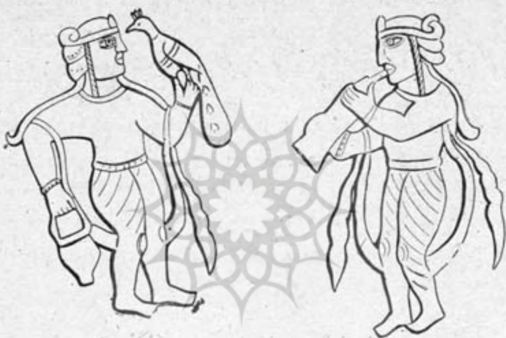
ش ۱۷ - بانوی نوازنده گاه علوم انسانی ش ۱۸ - بانوی رامشگر عهد ساسانی سر نای عهد ساسانی با طاروس و ظرف شبیه به یغلاوی

« اما ارغنون و آنرا در فرنگ بسیار در عمل آوردند و بر آن نایها بود که دو صف یلی یکدیگر ترکیب کنند و نایهای آنرا از قلمی سازند و نایهای بم آن طویل باشد و نایهای زیرقصیر؛ و در عقب آنها از طرف دست چپ دمی باشد چون دم آهنگران بر آنها استوار کرده؛ چنانچه نفخ از آن دم در مجموع نایها در رود؛ پس بدست چپ دم را درمند و بدست راست با نام عمل استخراج نغمات کنند و بر یک طرف ساز و بر دهان ثقیبها پردهها باشد مدور بمقدار نخودی که آنها را چون فرو گیرند دهان آن سوراخ گشاده شود و آواز مسموع گردد».