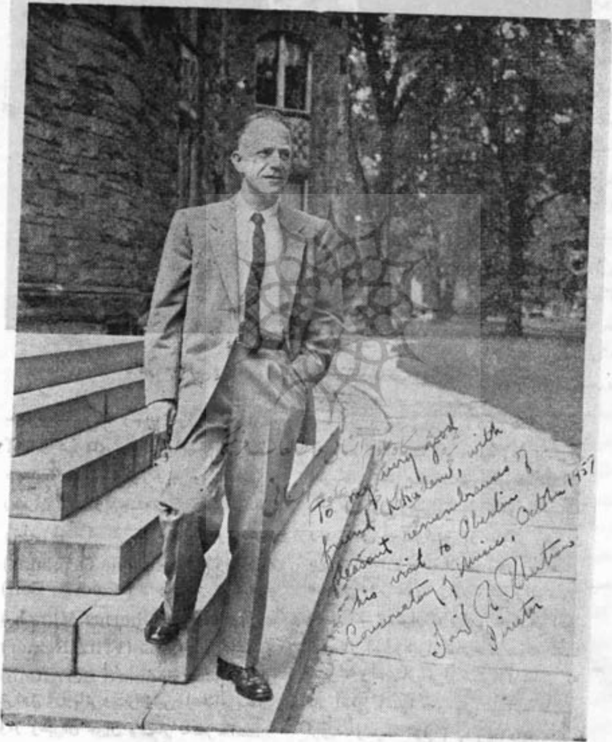
دکتر «رابرتسن» مدیر مدرسه «اوبرلین» و رهبر ارکستر.

است. البته نظیر این ارکستر در آمریکا و گمان میکنم در ردیف ارکسترهای خیلی فراوان میباشد. ارکستر سنفونیک مینیاپولیس که به رهبری آنتال دوراتی اداره میگردد با این ارکستر آشناسی داشتم مجدداً از