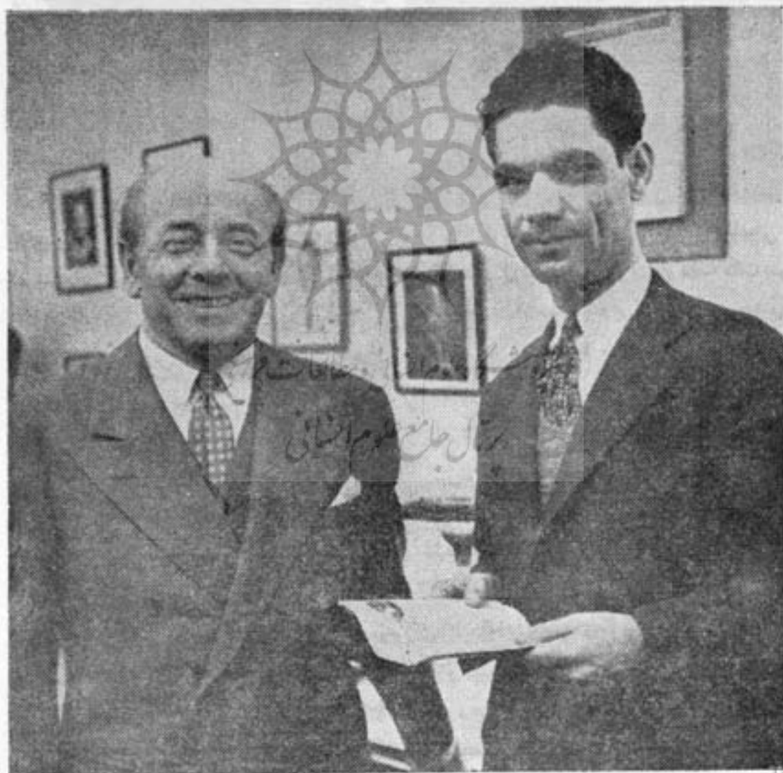
عطاءالله خادم میفاق و «اورماندی» رهبر ارکستر سنفونیک فیلادلفیا

می شدم . برای ورود باین مدارس هنرجویان پس از اتمام تحصیلات ابتدایی و متوسطه با گذراندن امتحان ورودی میتوانند ثبت نام نمایند و اکثر این مدارس دارای ساختمانهای پیشماری است که برای زندگی محصلین تخصیص داده شده و اکثر هنرجویان در این ساختمانها سکنی کرده و به مدارس خود نزدیک میباشد . عده شاگردان در هر کنسرواتوار یا مدرسه موسیقی در حدود ۵۰۰ الی ۶۰۰ نفر آمریکائی و غیر آمریکائی