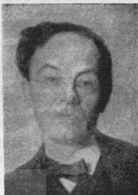
« دینبروک »

آلمان برکنار نمانده است. «Orthel» (۱۹۰۵) سازنده آثار زیبا و درعین حال تاریک و غم انگیزی است که کارلا جنبه هلندی دارد . سنفونیه‌های او در عالم موسیقی بین‌المللی حائز اهمیت بسیار است. برعکس ساخته-