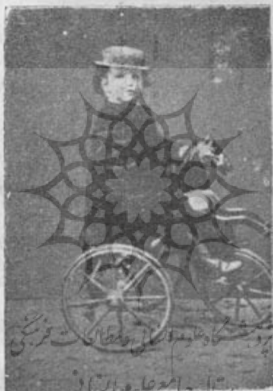
اشیل - کلود دبووسی در بچگی ( ۱۸۶۷ )

دبووسی در نه سالگی نزد یکی از استادان ایتالیائی شروع باآموختن پیانو کرد ولی استاد نامبرده در این کودک ذوق درخشنده ملاحظه نکرده بود تا روزی يك زن بنام (Mme. Fleurville) که یکی از شاگردان شپن بود (پیانو زدن او را پسندید و کلد پس از چند ماه توانست بکنسر و اتوار یاریس داخل شود . در کنسرو اتوار