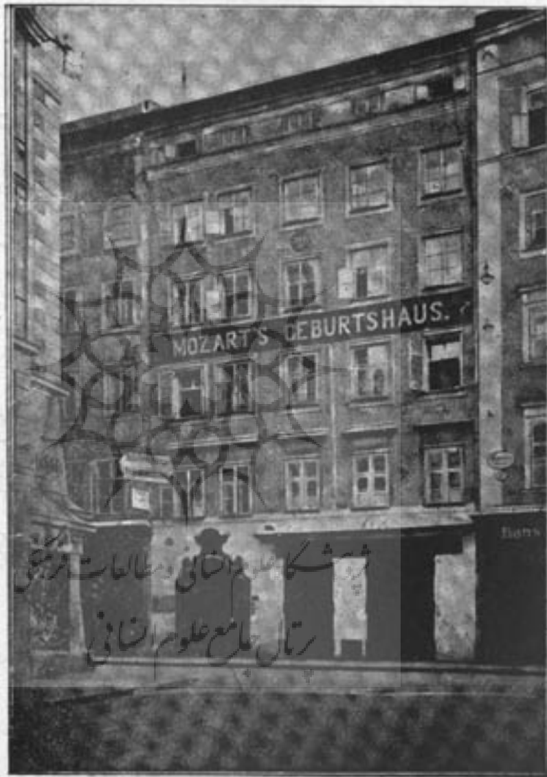
خانهٔ که موزار در آن بدنیا آمده

شده و بنظر میرسد که در اپرای ابرلین (۱) اولین مرتبه در کر (۲) شرکت کرده باشد . در سال ۱۷۶۲ که موزار شش و خواهرش یازده سال داشتند ، بقدری در موسیقی پیشرفت کردند که پدرشان برای دادن کنسرت در شهرهای مختلف تصمیم سفر گرفت . پس به مونیخ و از آنجا بوین مسافرت کردند و در شهرهای نام برده شهرت شایانی یافتند .