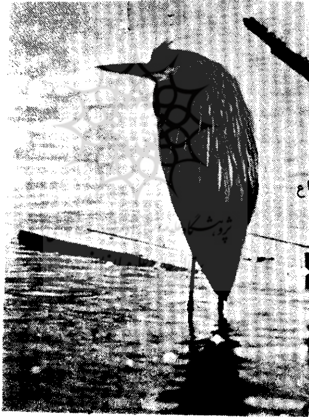
مرغ ماهیخوار با پاهای بلند و باریکش

این را نیز میدانیم که به گواهی صاحب نظران آگاه، جراحی به‌ویژه شکسته‌بندی و ترمیم استخوان - نهای شکسته بوسیله گج گرفتن ؛ تازه دوران تکامل