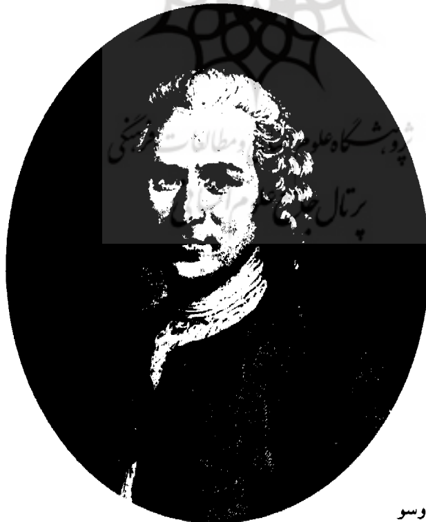
● ژان ژاک روسو

مسأله دیگری که در شکل‌گیری تاریخ مطرح شده