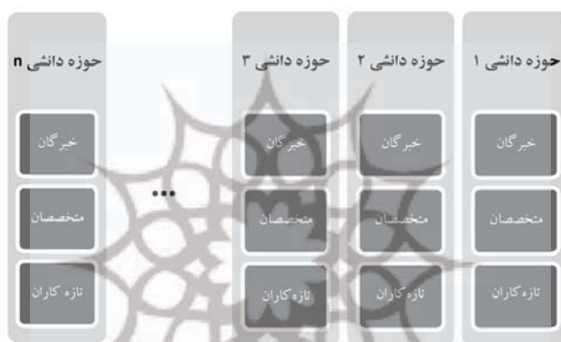
شکل ۵ نقشه منبع دانش داخلی کسب‌وکار

به این ترتیب حوزه‌های دانش موجود در سازمان، کارکنان صاحب آن‌ها و نیز سطح آن در سازمان مشخص شد. اکنون این اطلاعات در قالب شکل ۵ قابل تلفیقند. شکل ۵ در حقیقت نقشه منبع دانش در داخل کسب‌وکار سازمان است که ما در این گام سطح‌بندی دانش را نیز متناسب با نیازی که وجود دارد اضافه کرده‌ایم. در هر ستون یک حوزه دانش ذکر شده است و در ذیل آن مشخصات کارکنانی که صاحب این دانش می‌باشند به تفکیک سطوحی که در این دانش دارند، در صورت وجود مشخص می‌شوند.