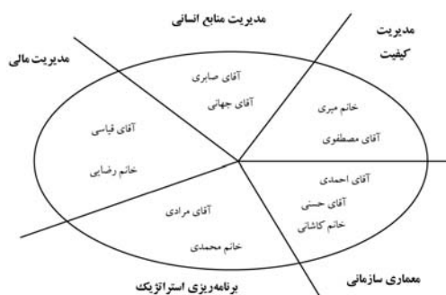
شکل ۱ نقشه منابع دانش