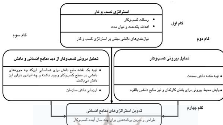
شکل ۲- چارچوب پیشنهادی