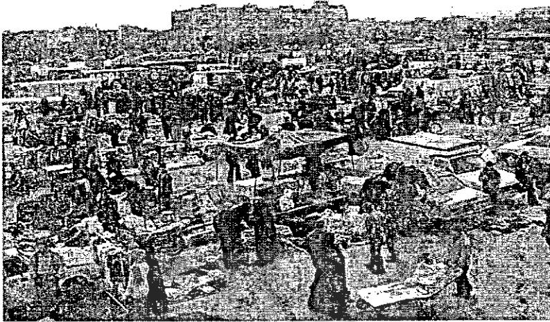
شکل (۱) تصویری از فعالیت‌های بخش غیررسمی در سبزه میدان تبریز