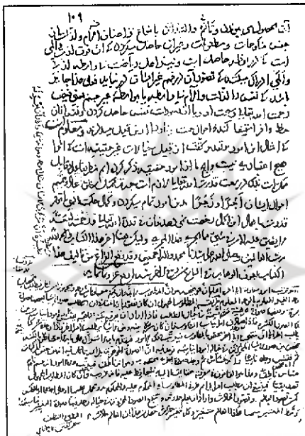
صفحه آخر نسخه قاموسی البحرین

اهل فن بخوبی واقفند که ابداع و نوآوری در یک علم چه در زمینه تبویب، تقریر مباحث و ارائه ادله سلبی و ایجابی، و چه در طرح مسأله ای جدید کاری است بس دشوار. از این رو نوآوران در هر حوزه همواره انگشت شمار بوده و به عنوان شاخص در روند تکاملی یک علم به شمار می آیند. در علم کلام نیز پس از تدوین و تولد آن، افراد معدودی چون