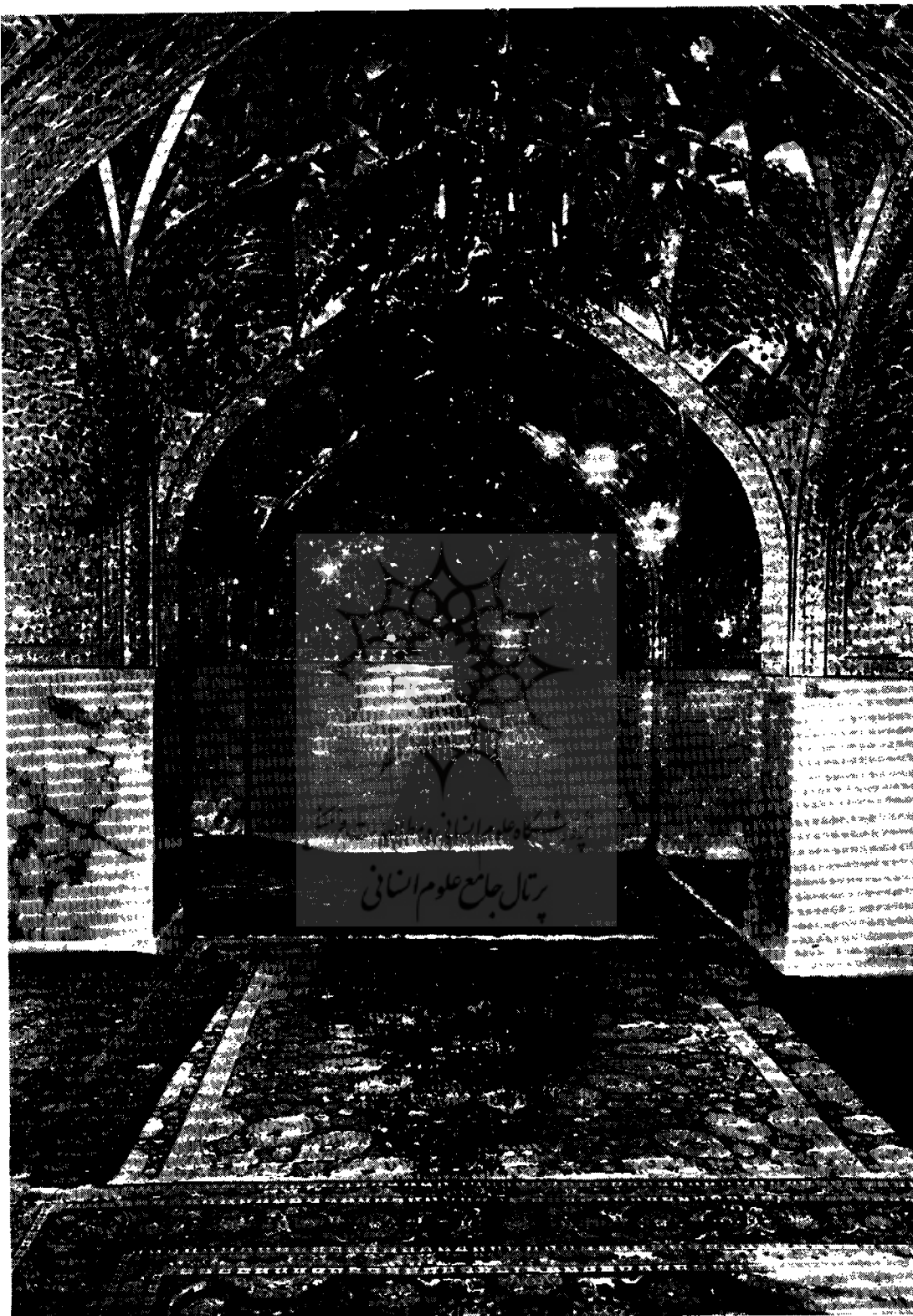
بنای مجلل دارالعهزہ کہ ما نہایت شکوہ خہ دنمائے . ممکنہ