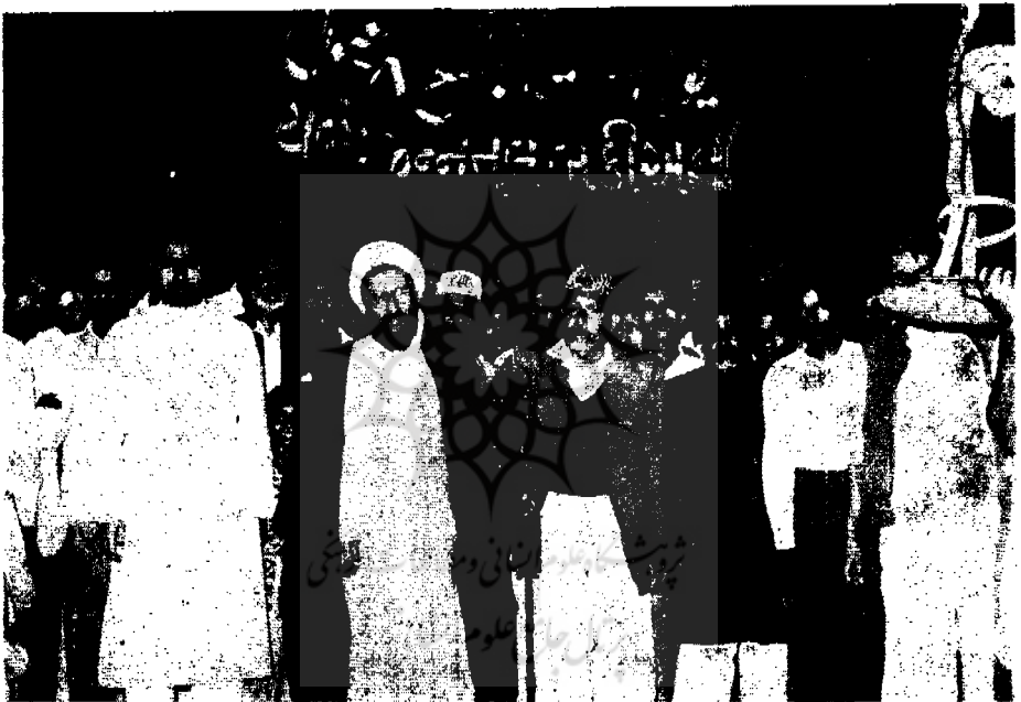
شیعیان کراچی وابسته به جنة البقیع به عزاداری پرداخته‌اند

در این ایام برنامه‌های موسیقی هم از رادیو کراچی حذف می‌شد و بجای آن برنامه‌های مذهبی اجرا میگردد .