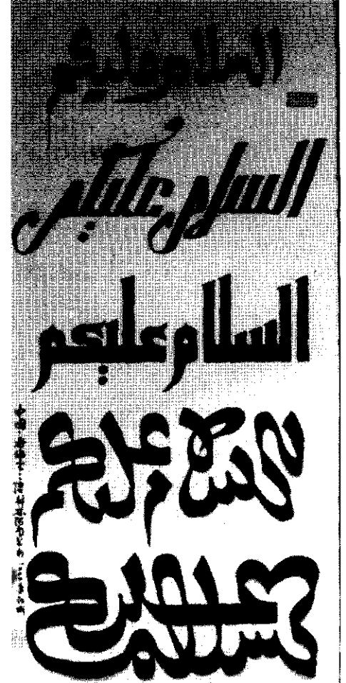
خطاطی‌های قرآنی اثر خطاطان چینی

و در بیان دیگری آمده است که از آن گرامی پرسیدند: