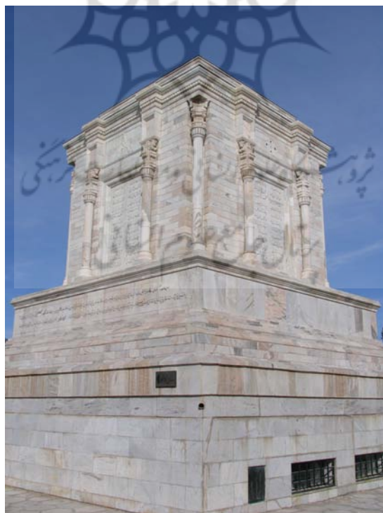
شکل ۲. مقبره حکیم ابوالقاسم فردوسی: نمادی از ایستادگی در احیای هویت ایرانی