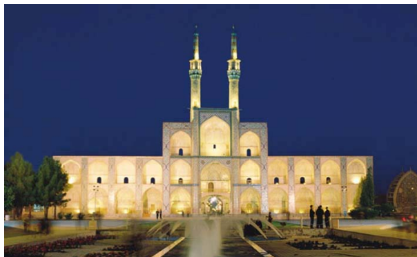
شکل ۵. تکیه امیر چخماق یزد: سامان دهنده حوزه خاص فرهنگی و نماد ارتباط اجتماعی