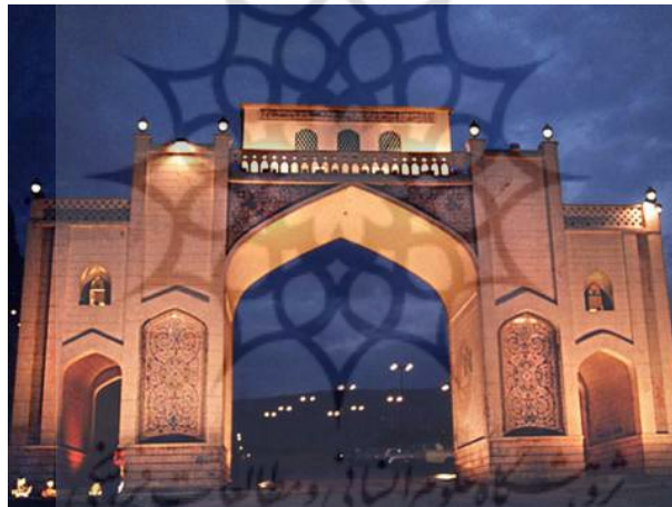
شکل ۴. دروازه قرآن شیراز: نمادی از دینداری ساکنان و بدرقه صمیمانه میهمانان