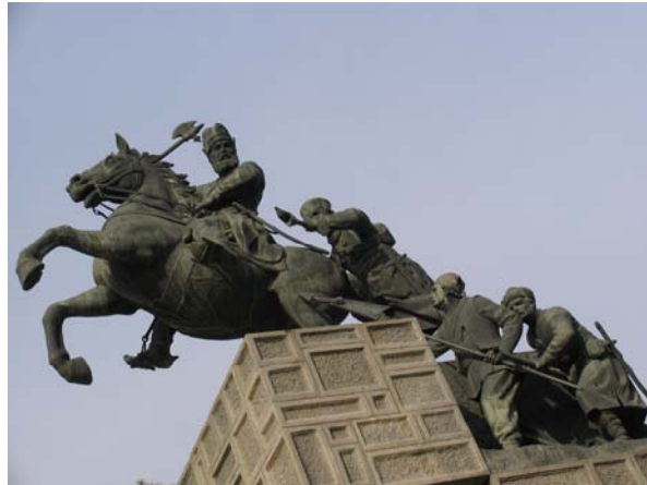
شکل ۳. تندیس نادر در مشهد مقدس: القاکننده حس هویت و نمادی از پایداری در حفظ میهن