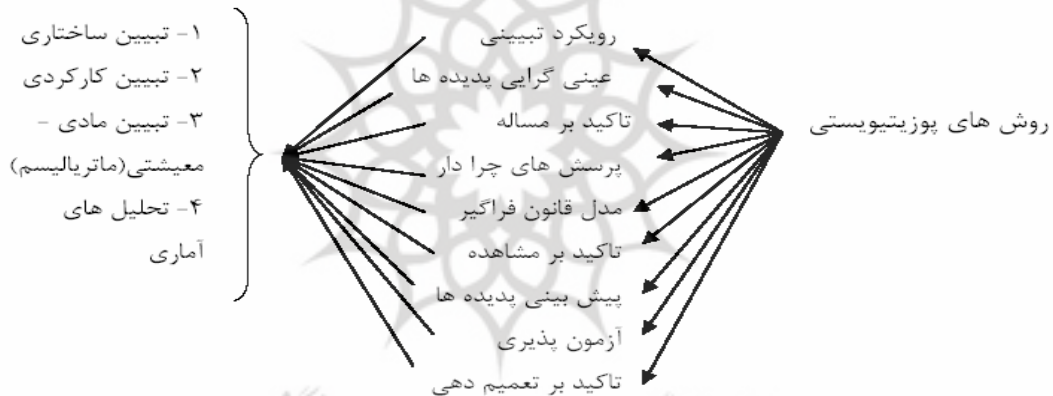
شکل ۱. مهم‌ترین شاخص‌های روش پوزیتیویستی

بنابراین مهم‌ترین ویژگی‌های روش پوزیتیویستی یا اثباتی را می‌توان این‌گونه ترسیم کرد: