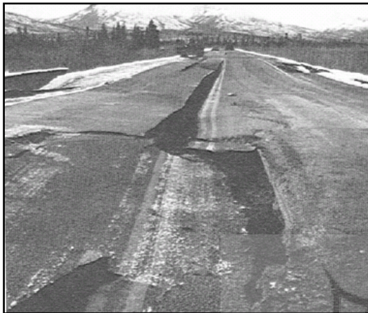
تصویر ۱. تخریب مسیر به علت تأثیر زلزله

راهکار دیگر برای کاهش آسیب‌پذیری، محدود کردن مسیرهای دوراهی و ترکیبی در تخلیه است، که منجر به پیوستگی جریان ترافیک برای مردم خارج از محدوده می‌شود [Cova et al, 2003]. این روش در شهرهای گسترده کارایی ندارد. چراکه در داخل یک واحد همسایگی مردم اطلاعات زیادی از چیزهای موجود دارند، به همین خاطر کنترل آنها آسان است. درحالی‌که در یک شهر گسترده استفاده از این روش ممکن نیست [Miriam & Shulman, 2008:20].