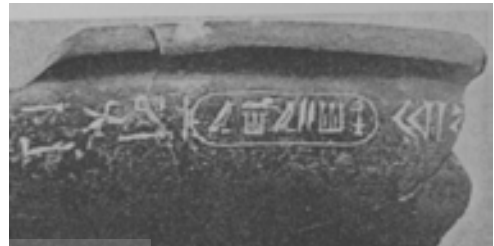
تصویر ۱۵ و ۱۶ تصویر ظرف کتیبه دار هخامنشی به دست آمده از تخت جمشید (E.F.Schmidt, 1957, S.83)