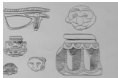
تصویر ۱۳. یافته های باستان شناسی مصری از کاخ داریوش در مصر (Sernberg, 2000, 156)