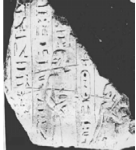
تصویر ۶ نقش برجسته پارسی ممفیس (Schulman, 1981, 103)

به نظر والتر هینس بعدها در مصر سنت های جدیدی از اقوام رخ می نماید: مثلاً یک نقش برجسته مسطح که از ممفیس به دست آمده، سه مصری را با موهای صاف و لباس های بلند با آستین های کوتاه نشان داده شده است. هر سه شکل رفتار مشابهی دارند: با دست سمت راستشان میج دست چپشان را گرفته اند [W.Hinz 1979]. بازوی چپ فقط خیلی ساده روی ساعد کنده کاری شده، نشان دهنده این است که از یک آستین پهن تشکیل شده، آنجا حتی اثر سطحی طرح چنین چیزی که از گردن قابل تشخیص باشد، وجود دارد. با وجود این می تواند فقط سایه ساده ای بر روی تصویر باشد [Schulman 1981, 105]. که منحصرأ این رفتار به وسیله داریوش اول در سرزمین ملل تابعه معمول شده بود، چنین رفتار و اقدام و تأثیر برانگیزی بعدها در زمان نبیره او داریوش دوم (۴۰۵-۴۲۳ ق.م) با این دستور که دست ها باید در آستین ها پنهان و پوشیده شوند، جایگزین شد [Hinz, 1979, 207].