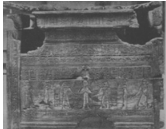
تصاویر ۲. تصویر تابوت چوبی متعلق به دوره هخامنشی در مصر (Freiherr, 1935-36, -140)