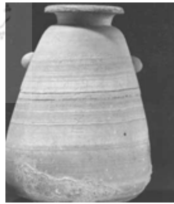
تصویر ۳. ظرف بزرگ کتیبه دار از مصر - موزه وین (Seipel, 2000, S.220)