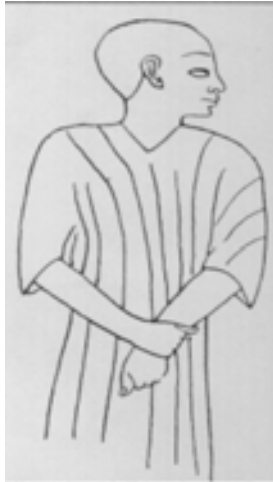
تصویر ۷. تصویر نقاشی نقش پارسی ممفیس (Hinz, 1979, 208)

نظر هنر شناسان یکی از سنت های شناخته شده ایرانی ها بوده است. احتمالاً این لباس نیز منشاء ایرانی داشته است. (تصویر ۷) (همان منبع)