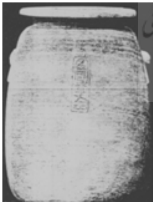
تصویر ۴. تصویر ظرف کتیبه دارپا رسی از مصر - برلین (Burchardt, 1911, 70)

براساس نظر اشمیت (R. Schmitt) بر روی یک ظرف مرمیری کتیبه دار چنین حکاکی شده است: (از پادشاهان هخامنشی داریوش اول، خشایار اول، اردشیر اول). برای جانشینان آنها نیز در دوره هخامنشیان تعداد زیادی از این ظروف کتیبه دار وجود داشته و تاکنون کشف شده است [Schmitt, 2001, 191]. برای آشنائی با نمونه های دیگر چنین ظروف کتیبه دار در حال حاضر دلیل کافی وجود دارد که به نمونه ای استناد شود که متعلق به اواخر دوران هخامنشیان در مصر بوده اند و نیز مشخصه و الگوی برای قرون بعدی بوده اند و نیز در سراسر خاور نزدیک و در عصر هخامنشیان برای همه شناخته شده بوده اند. ویژگی های ظروف مرمیری سفید یا آلاباستراها به این شکل بوده اند: این ظروف باریک و شکم برآمده ای (شکم دار) که غالباً طبق اسناد موجود از ایالات مختلف مصر به دست آمده اند و از جنس مرمیر با گردنی کوتاه، اما لبه ای پهن و دسته های کوچک و سطحی تخت و بدون پایه هستند. (تصاویر ۳ و ۴)