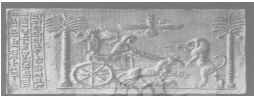
تصویری از مهر داریوش در ساتراپی مصر موزه لئید (Hinze, 1976, 176)

یکی از مهم ترین آثار دوران فرمانروائی پارس ها در مصر، مهرهای پادشاهی است که در اکثر ساتراپ ها و کشورهای ملل تابعه امپراطوری هخامنشی این مهر پادشاه بزرگ رایج بوده در واقع نه تنها چنین مهرهای منحصر بفردی وجود داشته بلکه بیش از ۳۰ عدد مهر در اختیار بوده است. چنانچه در زمان داریوش تمام مقامات عالیرتبه، از جمله کلیه استانداران که جزو مقامات عالیرتبه محسوب می شدند، یک چنین مهری را با نام داریوش داشته اند [Hinze, 1976, 175]. یک نمونه از مهر دوران فرمانروائی پارس ها در مصر از مهر داریوش که فقط یک نمونه منحصر بفرد بوده است. احتمالاً داریوش اول در سال ۴۸۷ قبل از میلاد در مصر آن را به استانداران تازه منصوب شده اعطاء کرده بود. دومین نمونه از مهرهای دوران فرمانروائی پارس ها در مصر به صورت یک مهر غلطان یا استوانه ای و تو خالی است. بر روی تصویر سطح مهر یکی از پادشاهان هخامنشی که با یک نیزه ای در دست دارد ایستاده، کنده کاری شده است. در جلوی او فرعون مصر نیز زانو زده است (تصویر ۵) [Seipel, 1996, 395].