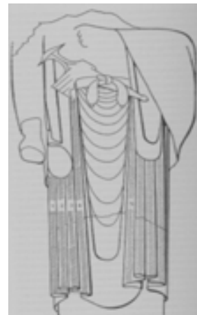
تصویر ۱۲. تصویر کتیبه های روی لباس مجسمه (Mysliwiec, 1998, S. 192.)