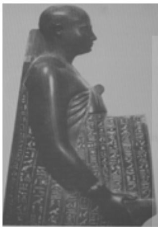
تصویر ۹. تصویر مجسمه اوجا هورسنت با سرمرمت شده (Hinz, 1976, 173.)

لقب ها و عنوان های خود در زمان چهار فرمانفرمای مصری و هخامنشی آماسیس، پسمامتیک، کمبوجیه و داریوش خود را بسیار نزدیک به آنها خوانده و می گوید: نزد تمام اربابان خود محترم بوده، و آنها او را با زیورهای زرین می آراسته اند. او از کمبوجیه بنام پدید آورنده نظم یاد کرده و او را مانند شاهان پیشین منزله از هر گونه خشونت و زیاده روی و نگهبان آیین ها و سنت های دینی و وارث همه فضیلت های باستانی معرفی می کند [رجبی، ۱۳۸۰: ۱۹۱]. بنابراین تصویر کمبوجیه در منابع یونانی بخصوص در کتاب هردوت تصویر مهاجم بیگانه سنگدلی است که علاقه یا حساسیتی نسبت به عقاید اجتماعی و مذهبی مصریان ندارد. قابل قبول علمای تاریخ و باستان شناسان نیست و همان طور که بیان شد متون مصری مربوط به آن روزگار نیز این تصویر را تأیید نمی کنند. چنانچه رویداد فتح مصر توسط کمبوجیه را اودجهورسنت در کتیبه ای در تندیس خود در واتیکان چنین شرح می دهد: (کمبوجیه شاه بزرگ همه سرزمین های بیگانه به مصر آمد و او بر تمام سرزمین مصر چیره شد. او فرمانروای بزرگ مصر شد و سمت ریاست پزشکان را به من سپرد. او مرا در کنار خود به عنوان دوست و مدیر کاخ قرار داد. من باعث شدم که شاه اهمیت سائزس مرکز سلسله سائزس را به رسمیت بشناسد، و این جایگاه نایت بزرگ است مادری که رع را زایید. من باعث شدم شاه اهمیت و بزرگی معبد نایت را به رسمیت بشناسد. شاه مصر علیا وسفلی به سائزس آمد و رهسپار معبد نایت شد و همانند هر شاهی که قبلاً چنین کرده بود زمین را لمس کرد (تصاویر ۸ و ۹) [کورت، ۱۳۷۹: ۵۰].