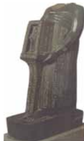
تصویر ۸. تصویر مجسمه اوجا هورسنت - واتیکا (Bresciani, 2002, 171.)