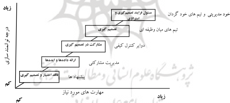
نمودار (۱) توانمند سازی (Daft and Noe, 2001, 218)

در مجموع، روشهای مختلف توانمند سازی را می‌توان در قالب پیوستاری ارائه نمود که "رابرت فورد" ۱ و "میرون فوتلر" ۲ این نمودار را طبق نمودار زیر طراحی کرده‌اند. این نمودار از جایی آغاز می‌شود که کارکنان تقریباً هیچ اختیاری ندارند (مثل کارگران خط مونتاژ) و علاوه بر آن، مشارکت بسیار سطحی و صوری است و مدیریت بدون هیچ‌گونه توضیحی، پیشنهادها را قبول یا رد می‌کند و این نمودار درجایی به پایان می‌رسد که توانمندسازی کامل وجود دارد؛ جایی که کارکنان حتی در تنظیم استراتژی سازمان مشارکت می‌کنند. توانمندسازی کامل زمانی حاصل می‌شود که افراد گروه خود‌گرا یا تیم‌های خود‌مدیریتی دارای اختیار استخدام، اعمال اقدامات انضباطی، اخراج اعضاء و حتی تعیین نرخ حقوق و دستمزد هستند.