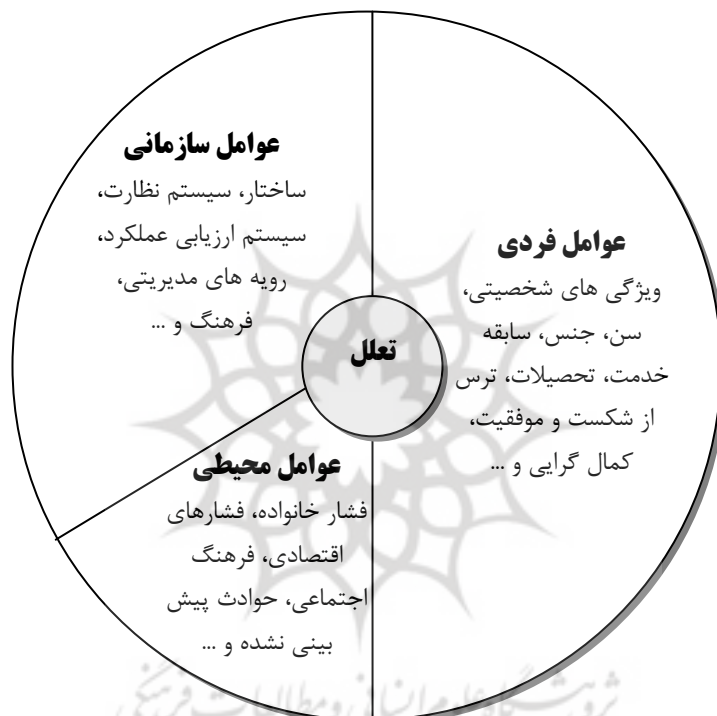
نمودار (۱): مدل مفهومی پژوهش

در ادبیات سازمانی، افزایش عملکرد مستلزم کارایی و اثربخشی منابع (از جمله انسان) است. چنانچه منابع انسانی در انجام وظایف محول، اهمالکاری و تعلل داشته باشند، کیفیت کار کاهش می‌یابد (Schraw, Wadkins & Olafson, 2007) و بدین ترتیب، سایر منابع نیز اتلاف خواهند شد (Motowidlo, Borman, & Schmidt, 1997). بر همین اساس، لازم است این مشکل و میزان شیوع آن در محیط‌های کاری، بررسی و راه حل‌های بهینه جهت کاهش آن ارائه شود.