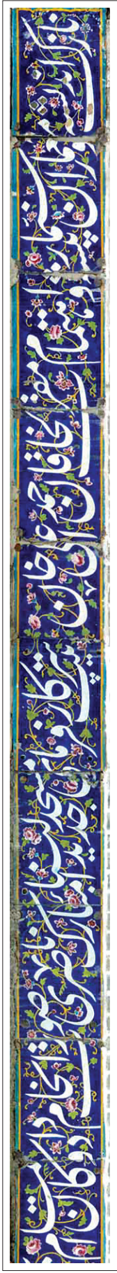
کتبه دوم، قسمت ۱.