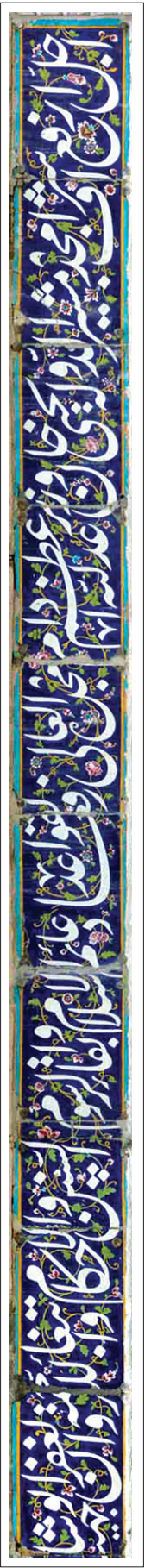
کتبه اول، قسمت ۱.