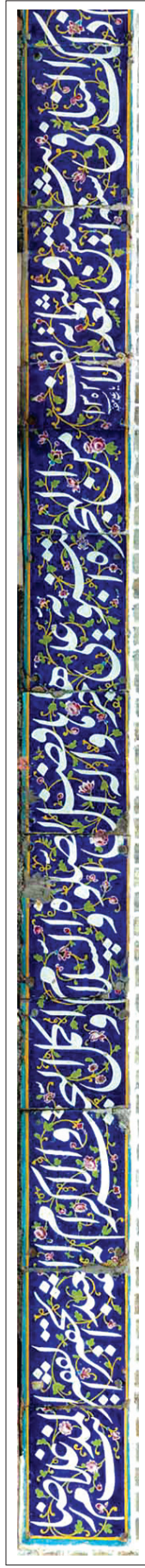
کتبه دوم، قسمت ۲.