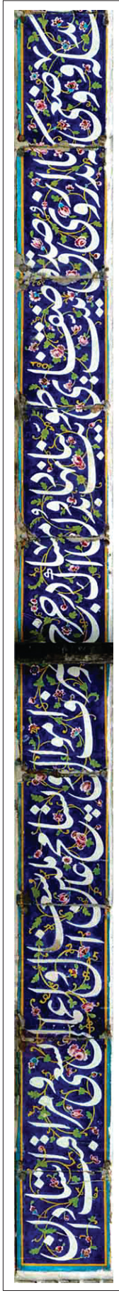
کتبه اول، قسمت ۲.