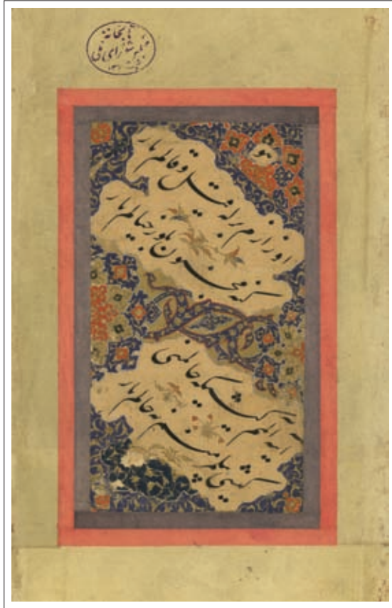
ت ۱۱: قطعه منسوب به فتحعلی شیرازی (۶). اندازه داخل جدول ۱۹×۵/۱۰ سم. (تهران، کتابخانه مجلس شورای اسلامی، مرقع ش ۷۴۹)