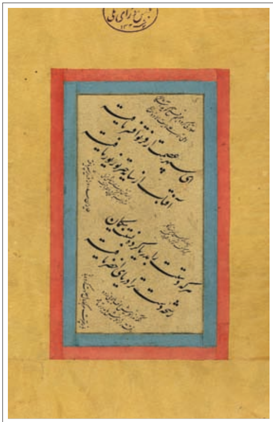
ت ۷: قطعه منسوب به میرخلیل قلندر. اندازه داخل جدول ۸/۱۵ سم (کتابخانه مجلس، مرقع ۷۴۹).