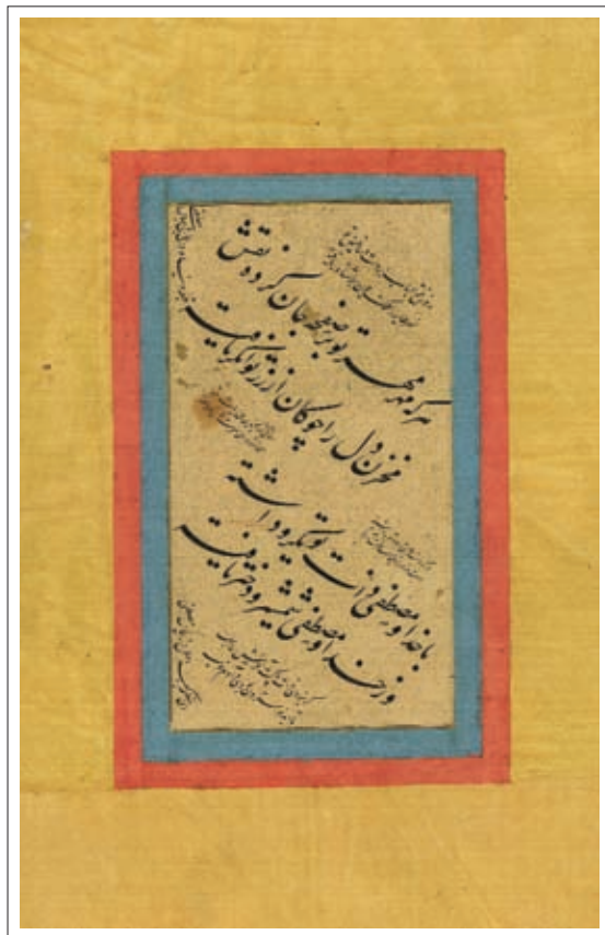
ت ۶: قطعه منسوب به میرخلیل قلندر. اندازه داخل جدول ۵/۱۴ سم (کتابخانه مجلس، مرقع ۷۴۹).