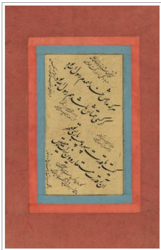
ت ۸: قطعه منسوب به میرخلیل قلندر. اندازه داخل جدول ۵/۱۴ سم (کتابخانه مجلس، مرقع ۷۴۹).