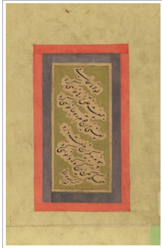
ت ۱۰: قطعه با رقم «جواهر رقم». اندازه داخل جدول ۱۲/۵×۵/۵ سم. (تهران، کتابخانه مجلس شورای اسلامی، مرقع ش ۷۴۹)