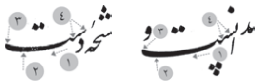
چلیپای میرخلیل قلندر، ت ۱ ■ مرقع، ت ۷

در دو کلمه «ندانست» * در قطعه چلیپا و «دست» * در مرقع نیز شیب کشیده‌ها (۱) و محل فرود آن روی مسطح که در قسمت انتهایی آن است (۲) کاملاً مثل یکدیگر است. انتهای این کشیده‌ها به تدریج کمی نازک و گرد می‌شود که کاملاً شبیه به هم است (۳). این تشابه تقریباً در همه کشیده‌های تخت نوشته شده در مرقع دیده می‌شود. مانند «عطایت» * و «ذات» * . تشابه شکل دندان‌های سین و نحوه اتصال آن به کشیده، در دو کلمه «دست» و «ندانست» نیز قابل توجه است (۴).