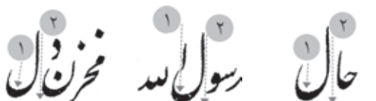
مرقع، ت ۹ ■ مرقع، ت ۸