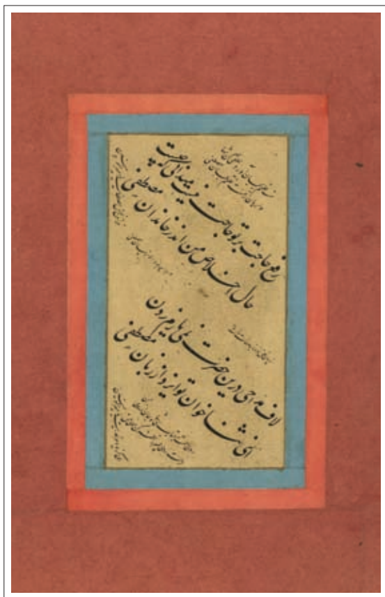
ت ۹: قطعه منسوب به میرخلیل قلندر. اندازه داخل جدول ۵/۱۴ سم (کتابخانه مجلس، مرقع ۷۴۹).