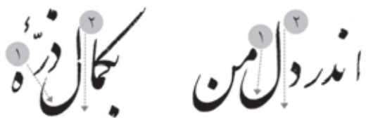
چلیپای میرخلیل قلندر، ت ۱ ■ چلیپای میرخلیل قلندر، ت ۱

ب) قلم‌گذاری و جهت حرکت قلم که متمایل به عمودی است، از خصوصیات بارز خط این خوشنویس است و در هر دو نمونه یعنی چلیپای میرخلیل و مرقع به خوبی مشاهده می‌شود. دوایر و صعود و نزول‌های حقیقی قائم‌تر از حد معمول نوشته شده‌اند؛ گودی دوایر در قسمت کانون دایره حالت شکستگی دارد (۱) و اغلب کوچک و ایستاده نوشته شده‌اند. دایره‌های لام با الف بلند که نه تنها عمودی، بلکه از بالا به پایین متمایل به راست است در هر دو نمونه کاملاً یکسان است (۲).