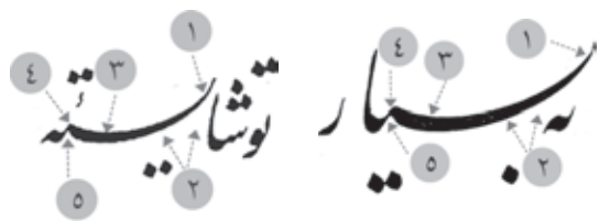
چلیپای میرخلیل قلندر، ت ۱ ■ مرقع، ت ۳