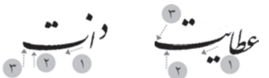
مرقع، ت ۵ ■ مرقع، ت ۶

ب) قلم‌گذاری و جهت حرکت قلم که متمایل به عمودی است، از خصوصیات بارز خط این خوشنویس است و در هر دو نمونه یعنی چلیپای میرخلیل و مرقع به خوبی مشاهده می‌شود. دوایر و صعود و نزول‌های حقیقی قائم‌تر از حد معمول نوشته شده‌اند؛ گودی دوایر در قسمت کانون دایره حالت شکستگی دارد (۱) و اغلب کوچک و ایستاده نوشته شده‌اند. دایره‌های لام با الف بلند که نه تنها عمودی، بلکه از بالا به پایین متمایل به راست است در هر دو نمونه کاملاً یکسان است (۲).