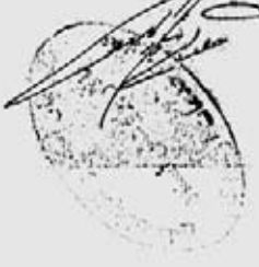
برگی از نمونه اسناد صورت جلسه استنطاق (سازمان اسناد و کتابخانه ملی).

توجه اندک - بعد از این در دست است و در آن در دست است و در آن در دست است معنی ملک الدوله است و در آن در دست است و در آن در دست است که در دست است و در آن در دست است و در آن در دست است رواقه مکه است و در آن در دست است و در آن در دست است X ?