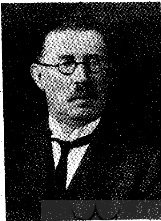
زندگی‌یاد زین‌الدین کسرون

آن نیست چون راوی دانشمند آن بحمدالله در قید حیاتند و نقل قول صریح و مستقیم از خود ایشان است. سوآلی که در اینجا به ذهن می‌آید اینست که چرا استاد فروزانفر می‌فرمایند «جرأت نمی‌کنم». به سبب آنکه شادروان دکتر مینوی می‌خواسته‌اند این کار را بکنند؟ که البته نکردند. لفظ «جرأت» که در اینجا محملی ندارد. اگر استاد فروزانفر مثلاً می‌فرمودند به احترام جناب آقای مینوی که می‌خواهند این کار را انجام دهند من متن را تصحیح نمی‌کنم، عذر مؤدبانه عقل‌پسندی بود. اما ایشان به صراحت می‌فرمایند «جرأت نمی‌کنم». از طرف دیگر، همه بر جامعیت شادروان استاد فروزانفر معترفیم. ایشان از شمار معدود دانشمندان عظیم‌الشان ایران بود که شایستگی و اهلیت تصحیح مثنوی معنوی را از همه جهات در خود جمع داشت: ادیب و ادب‌دانی کم‌نظیر بود که بر مهام متون ادب فارسی تسلط کامل داشت، مثنوی شناس کامل بود، قرآن، حدیث و ادبیات عرب را استادانه می‌دانست. رساله او در شرح احوال و زندگی مولانا جلال‌الدین گویای شناخت کامل وی از مولانا است. احادیث مثنوی و مأخذ قصص و تمثیلات مثنوی وی هنوز که هنوز است در شمار ارزنده‌ترین منابع محسوب است. شرح مثنوی شریف، با آنکه از بیت سه هزار و دوازدهم دفتر اول مثنوی تجاوز نکرده، بهترین و مستندترین گواه است بر شایستگی بی‌چون و چرای آن استاد یگانه برای تصحیح مثنوی معنوی که به هیچ روی انکارپذیر نیست. شیوه علمی فن تصحیح متون را نیز عالمانه می‌دانست و تصحیح انتقادی همین ترجمه رساله قشیریه که جناب آقای دکتر استعلامی هم ضمن گفت و گوی خود با کلک